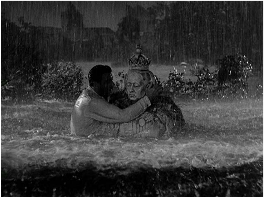
(Il pittore inglese Tom Ransome, interpretato da George Brent, si aggrappa al grande Simulacro imperiale nel film americano The Rains Came , 1939)

Quanto segue costituisce una riflessione successiva e conseguente a un