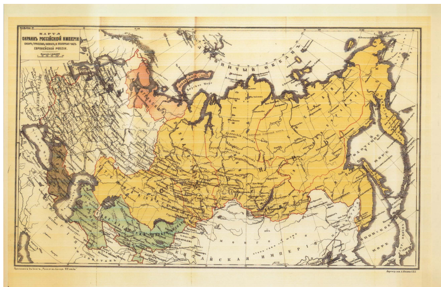
Fig. 1 Carta delle periferie dell'Impero russo, 1900

Le discussioni vivaci sull'opportunità di concedere gli zemstva a nuove regioni, nelle province baltiche e polacco-lituanee oppure, in direzione opposta, in alcune zone della Siberia occidentale, vertevano sulla valutazione del grado di assimilazione di tali province, soprattutto sulla presenza di una classe dirigente locale affidabile a cui delegare alcune funzioni amministrative senza che ciò comportasse rischi di instabilità politica e tendenze secessionistiche. Si discuteva cioè se tali governatorati fossero sufficientemente “pronti”, dal punto di vista delle priorità imperiali, per essere governati con uno strumento già da tempo adottato al centro.