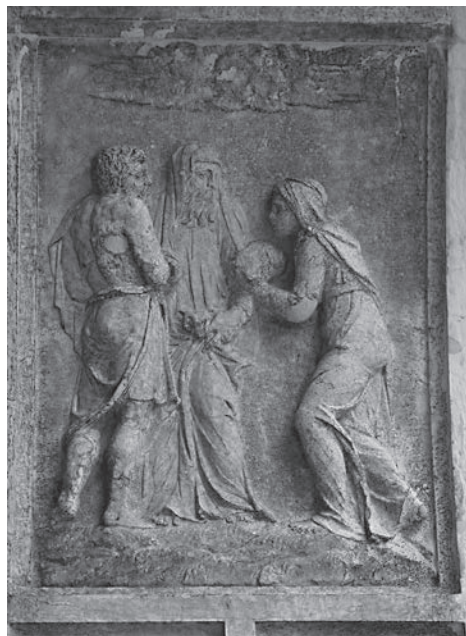
FIG. 7. Venezia, Libreria Sansoviniana. Arco di Saturno, Astuzia di Rea.

L'arcata successiva è dedicata alla prima generazione divina: sulla chiave d'arco la protome di Saturno, sull'intradosso la figura intera (FIG. 6). Abbandonata l'immagine austera della divinità avvolta nella toga e con il capo velato, tipica del repertorio figurativo di età romana, 15 il dio veste ora una corta tunica, e si presenta munito di falce e clessidra, secondo l'iconografia, sorta nel Medioevo e sviluppata in età rinascimentale, che lo identifica con la personificazione del Tempo. 16 Ai lati una scena di non immediata interpretazione che riconsidereremo tra breve (FIG. 7); dalla parte opposta un sacrificio umano sottolinea l'aspetto cupo e sanguinario del dio. 17