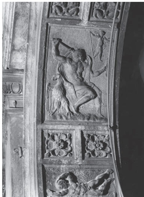
FIG. 17. Venezia, Libreria Sansoviniana. Arco di Minerva, Nascita di Minerva dal cervello di Giove.