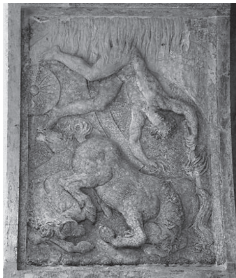
FIG. 13. Venezia, Libreria Sansoviniana. Arco di Giove, Caduta di Fetonte.

utilizzata – fonte figurativa, o fonte letteraria liberamente tradotta in immagini – 37 la scena mantiene comunque una sua incongruenza, che tradisce l'impaccio dell'ignoto scultore di fronte al soggetto assegnatogli: se era intenzione raffigurare lo stratagemma di Rea, la figura maschile vista di scorcio è di troppo; se si tratta di Deucalione e Pirra, è di troppo Saturno, e la collocazione del rilievo è errata. Credo insomma che ci si trovi di fronte ad uno di quei casi, già segnalati da Th. Hirthe, di errata trasposizione del soggetto mitico. 38 È probabile che l'intenzione fosse quella di raffigurare, conformemente alla divinità posta sulla chiave d'arco, l'episodio dell'astuzia di Rea. Essendo questo un tema evidentemente assai poco noto, nella formulazione dello schema iconografico lo scultore fu influenzato dalle più note immagini del mito di Deucalione e Pirra – anch'esso peraltro riferentesi alle vicende ancestrali della storia universale –.