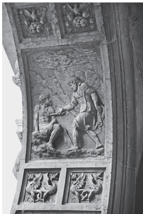
FIG. 5. Venezia, Libreria Sansoviniana. Arco di 'Fanete', Prometeo.

conservato alla Galleria Estense di Modena. 11 Le vicende collezionistiche di quest'ultimo sono documentate a partire dalla prima metà del XVIII secolo, 12 ma alcuni disegni cinquecenteschi e un rilievo di soggetto analogo inserito nella facciata dell'Odeo Cornaro a Padova, databile negli anni intorno al 1525, 13 dimostrano che esso era conosciuto già nel Rinascimento, e correttamente interpretato come immagine simbolica del tempo. 14 Al dio che sorge dall'uovo cosmico rispondono le imprese di Prometeo, su cui torneremo in seguito: la creazione dell'uomo da una parte (FIG. 5), l'adorazione del fuoco sottratto agli dèi dall'altra.