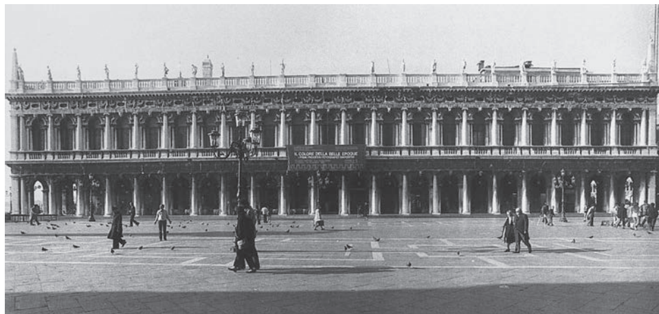
FIG. 1. Venezia, Libreria Sansoviniana (da MORRESI 1999, fig. 95).

sione dei lavori per un paio di anni (e costò al Sansovino qualche mese di prigione); i lavori ripresero nel 1547 e si conclusero nel 1553, senza però che fosse conclusa l'ala prospiciente il Molo. La Libreria rimase incompiuta sino al 1583-1591, quando fu portata a