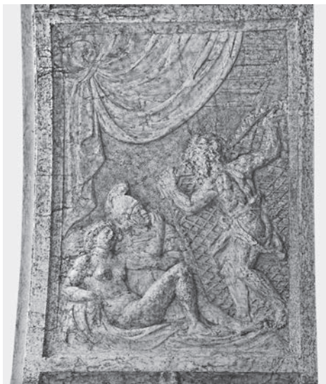
FIG. 14. Venezia, Libreria Sansoviniana. Arco di Venere, Venere e Marte nella rete di Vulcano.