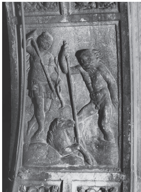
FIG. 18. Venezia, Libreria Sansoviniana, arco di Minerva, Contesa tra Minerva e Nettuno per il possesso dell'Attica (Archivio Fotografico della Biblioteca di Storia dell'arte della Fondazione Giorgio Cini).

influsso diretto del testo di Pausania sia da tenere in considerazione credo possa trovare conferma nella storia della recezione e della fortuna moderna dell'opera, in cui Venezia riveste il ruolo di assoluta protagonista. 48 Il codice più antico che conserva per intero la Periegesi è il Venetus Marcianus graecus 413, donato dal Bessarione al Senato nel 1468, e che dunque rispetto ai due rilievi in questione si trovava, per così dire, al piano di sopra. La prima traduzione latina è quella dell'umanista veronese Domizio Calderini, del 1477, arrestatasi all'inizio del secondo libro per la morte del traduttore (e dunque limitata sostanzialmente all'Attica), ma pubblicata a Venezia intorno al 1500, e ripubblicata nel 1540, negli anni in cui si erigeva la Libreria. L'editio princeps di Aldo Manuzio, per le cure del Musuro, appare nel 1516.