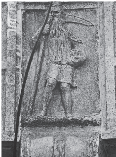
FIG. 6. Venezia, Libreria Sansoviniana. Arco di Saturno, Saturno.