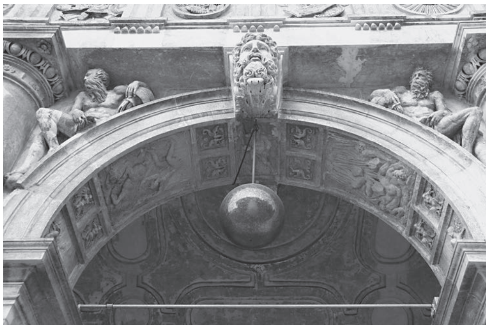
FIG. 3. Venezia, Libreria Sansoviniana. Arco di Giove (foto Autore).

vedeva una serie di personificazioni nella volta della scala monumentale di accesso, mentre il salone principale era dominato da figure di filosofi e da dipinti allegorici e mitologici. 10