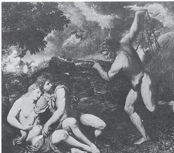
FIG. 16. Paris Bordon, Venere e Marte presi nella rete di Vulcano , Berlino, Gemäldegalerie (da MARIANI CANOVA 1984, fig. a p. 43).

Mentre in questi due casi la fonte di riferimento è principalmente Ovidio, nell'arcata successiva dedicata a Minerva la scelta dei temi risponde ad un intreccio di riferimenti testuali più complesso. I rilievi presentano da un lato la nascita della dea dal cervello di Giove, dall'altro la contesa tra Minerva e Nettuno per il possesso dell'Attica (FIGG. 17-18). Nell'arte rinascimentale la nascita di Minerva è un tema assai poco frequentato, la contesa poco di più. 46 Ma ciò che, per quanto mi è noto, è privo di confronti, è la giustapposizione dei due motivi, che richiama immediatamente i soggetti dei frontoni del Partenone, menzionati da Pausania nel primo libro della Periegesi . 47 Che l'ipotesi di un