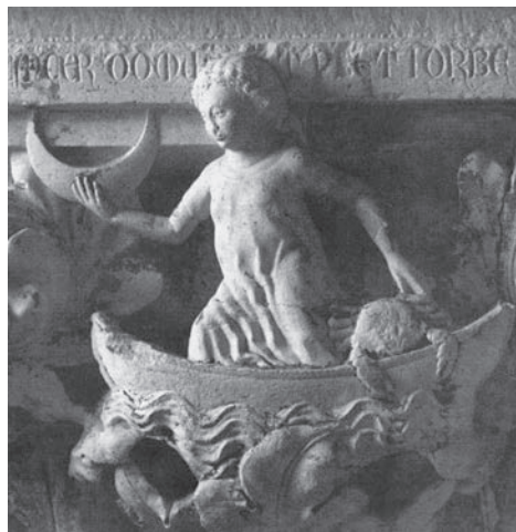
FIG. 21. Venezia, Palazzo Ducale. Capitello dei pianeti, particolare (da MANNO 1999, fig. a p. 121).