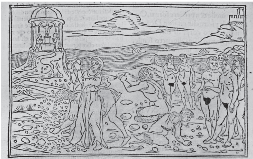
FIG. 10. Venezia, Biblioteca Nazionale Marciana, Ovidio Metamorphoseos vulgare , Venezia, 1497, p. vir.

L'episodio compare in varie edizioni ovidiane illustrate, a partire dal già citato Ovidio Metamorphoseos vulgare del 1497 (FIG. 10), e in qualche dipinto e affresco più o meno coevi al rilievo marciano, tra i quali mi limito a ricordare la tavola attribuita ad Andrea Schiavone un tempo nelle Gallerie dell'Accademia, ed ora nella Sala di Callisto di Palazzo Grimani a Venezia. 31 Ma mentre in tutte queste testimonianze gli elementi fondamentali della narrazione vengono chiaramente esplicitati (il tempio in cui Deucalione e Pirra ricevono il vaticinio di Temi; la coppia che raccoglie e getta dietro le spalle le pietre; la nuova stirpe degli umani che sorge non appena le pietre toccano il suolo) co-