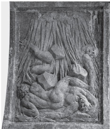
FIG. 12. Venezia, Libreria Sansoviniana. Arco di Giove, Caduta dei Giganti.