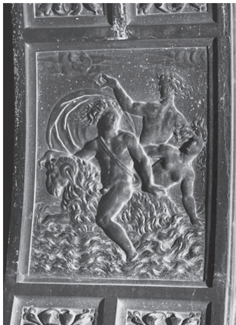
FIG. 19. Venezia, Libreria Sansoviniana. Arco di 'Cerere', Elle e Frisso (foto Autore).

La tendenza a combinare in una narrazione più o meno coerente fabulae tratte da fonti eterogenee è testimoniata anche nell'ultima arcata del complesso, l'unica tra quelle figurate rivolta verso il molo, pertinente al completamento della fabbrica negli anni '80 del Cinquecento sotto la direzione dello Scamozzi. Il rilievo interpretato usualmente come 'Baccanale' (FIG. 19) rappresenta in realtà la storia di Frisso e Elle, che sfuggono al sacrificio voluto dal padre Atamante in groppa all'ariete dal vello d'oro inviategli da Nefele. Elle è colta nell'attimo drammatico in cui scivola nel mare, che dall'eroina verrà chiamato Ellesponto. La descrizione dello straordinario viaggio aereo è ovidiana. Non compare tuttavia nelle Metamorfosi , ma nel terzo libro dei Fasti , 53 da cui sembra derivare anche il dettaglio patetico del giovane che tende la mano alla sorella nel tentativo di salvarla («... poco mancò che Frisso, porgendo le mani distese, non perisse volen-