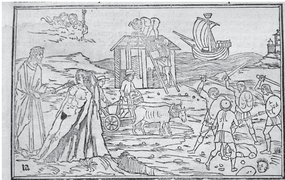
FIG. 9. Venezia, Biblioteca Nazionale Marciana. Ovidio Metamorphoseos vulgare , Venezia, 1497, p. 11r.

mentatore, «... qui non volse altro dire se non a dimostrare come Idio creò lo primo uomo ... per le mani di Prometheo...». 26