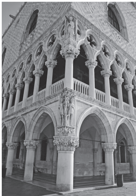
FIG. 20. Venezia, Palazzo Ducale. Angolo sudoccidentale.

Chunque fosse l'estensore del progetto, egli dovette tenere ben presente il contesto monumentale in cui si inseriva l'edificio, la Piazzetta dominata dalla facciata occidentale del Palazzo Ducale. Gli stretti rapporti che intercorrono tra quest'ultimo e la Libreria sono stati sottolineati più volte, anche di recente, sempre però in maniera generica. 59 Tuttavia, non mi risulta che sia mai stata notata la perfetta equivalenza semantica tra l' incipit del programma figurativo dei due monumenti. La storia dell'umanità svolta nei capitelli figurati del portico di Palazzo Ducale inizia all'angolo sudoccidentale (FIG. 20), che è l'autentico fulcro del programma, 'la prua della vita umana'. 60 Il capitello d'angolo presenta i sette pianeti con i dodici segni zodiacali, e l'immagine della creazione dell'uomo: pianeti e Zodiaco (FIG. 21) corrispondono evidentemente alla figura di 'Fanete' / Tempo, circondato dalla fascia zodiacale; la creazione di Adamo da parte di Dio (FIG. 22), peraltro resa con uno schema iconografico piuttosto simile a quello