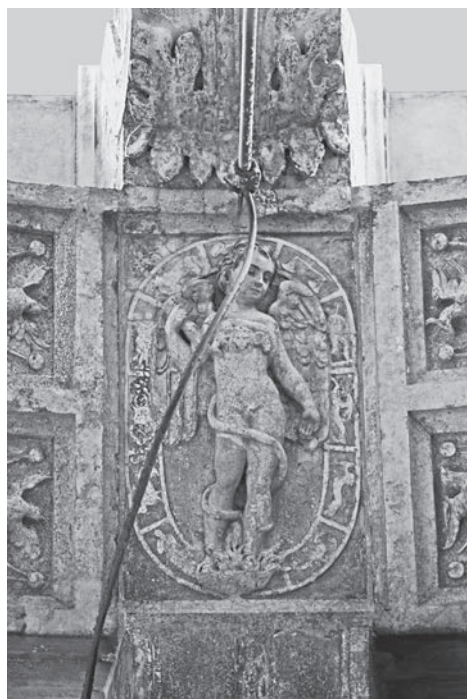
FIG. 4. Venezia, Libreria Sansoviniana. Arco di 'Fanete', Fanete.