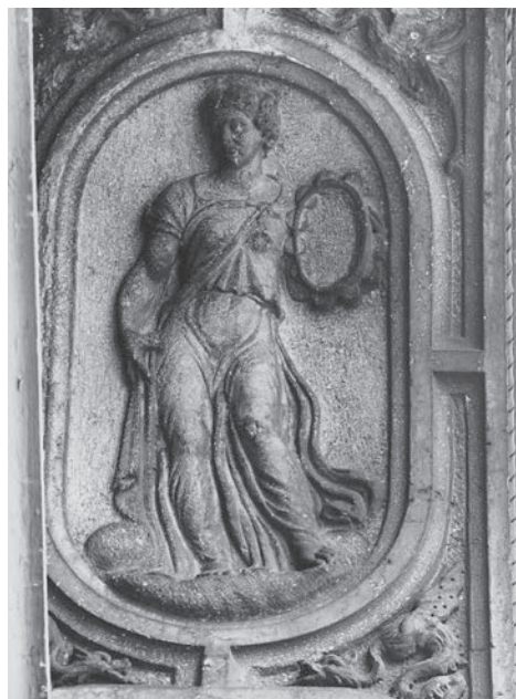
FIG. 2. Venezia, Libreria Sansoviniana. Musa.

Nel panorama monumentale della città il progetto proposto da Sansovino costituisce una innovazione senza precedenti: una facciata a due ordini, con porticato dorico a piano terra, e primo piano di ordine ionico, conclusa da una terrazza delimitata da una balaustra con obelischi angolari e statue di divinità pagane. Tralascio il complesso e articolatissimo programma figurativo degli ambienti interni, che pre-