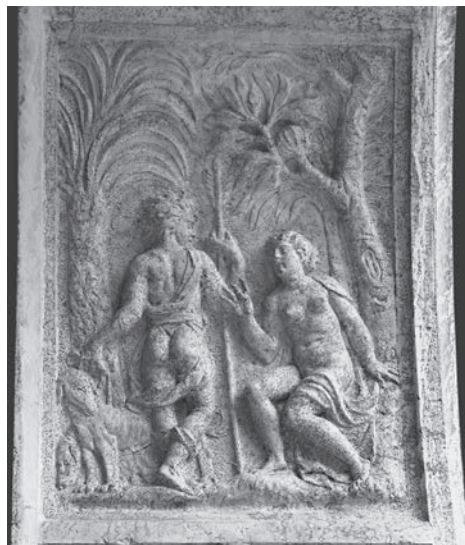
FIG. 15. Venezia, Libreria Sansoviniana. Arco di Venere, Venere e Adone.

sione, cui non è estraneo un rimando ideologico alla contingente situazione politica: recenti studi hanno sottolineato l'utilizzo sistematico dei miti della caduta dei Giganti e di Fetonte finalizzato alla celebrazione dell'imperatore in numerosi contesti di grande prestigio, anche pubblici. 40 Tra Francesi e Spagnoli la Serenissima riuscì a mantenersi neutrale, e le due scene scolpite nell'intradosso dell'arco di Giove andranno dunque intese come generiche allusioni alla punizione della superbia e alla giustizia divina, di cui si fa garante il padre degli dèi olimpici. Tuttavia non va trascurato il fatto che il tema della giustizia costituisce da sempre uno degli ingredienti più importanti del 'mito di Venezia', e dunque un intenzionale riferimento a questo aspetto fondamentale del buon governo è più che probabile. Il Sansovino stesso, pochi anni prima, aveva posto come fulcro del programma figurativo dell'adiacente Loggetta l'immagine di Venezia con spada e bilancia affiancata da leoni, che il figlio Francesco esplicitamente riconosce come personificazione della giustizia; 41 ed entrambi i rilievi – quello allegorico della Loggetta, e quello mitologico della Libreria – fanno da pendant al tondo con Venezia come Giustizia che troneggia al centro della facciata di Palazzo Ducale rivolta verso la Piazzetta, e che, come notato da tempo, corrisponde esattamente all'ingresso della Libreria. 42