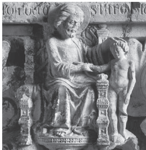
FIG. 22. Venezia, Palazzo Ducale. Capitello dei pianeti, particolare (da MANNO 2004, fig. 13).

utilizzato nei sarcofagi romani di Prometeo, alla creazione del primo uomo da parte del titano. Alla preistoria dell'umanità alludono il gruppo di Adamo ed Eva e l'albero del peccato, posto immediatamente al di sopra del capitello astrologico, e il rilievo con l'adorazione del fuoco, che fa da contraltare al mito di Prometeo. E ancora, la figura sovrastante dell'arcangelo Michele, simbolo della giustizia divina, trova corrispondenza nel terzo arco della Libreria, con le immagini di Giove che fulmina i Giganti e la caduta di Fetonte.