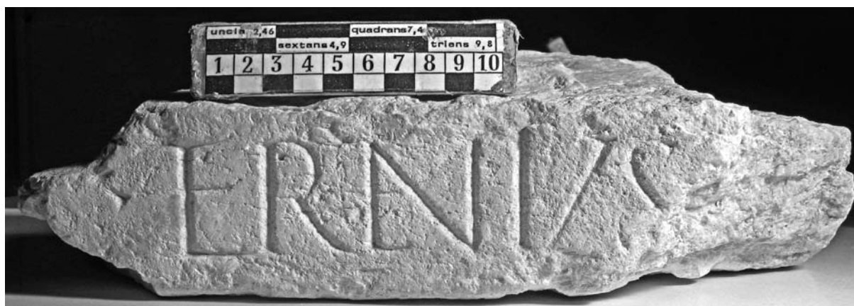
Fig. 2. L'iscrizione conservata nel Museo Civico di Belluno (n. inv. MCBL 260.)

Maria Silvia Bassignano 8 , occupandosi del supplemento al lavoro di Luciano Lazzaro, propose la lettura [- -]terni, interpretando la prima parte del testo come la terminazione di un cognomen al caso genitivo, senza tuttavia proporre alcuna integrazione data la molteplicità di soluzioni possibili 9 .