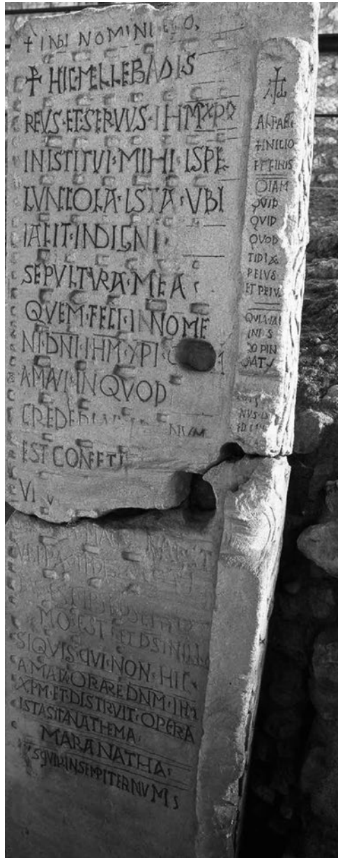
Fig. 4. Ipogeo dei Duni, Poitiers, particolare (sec. VII-VIII)