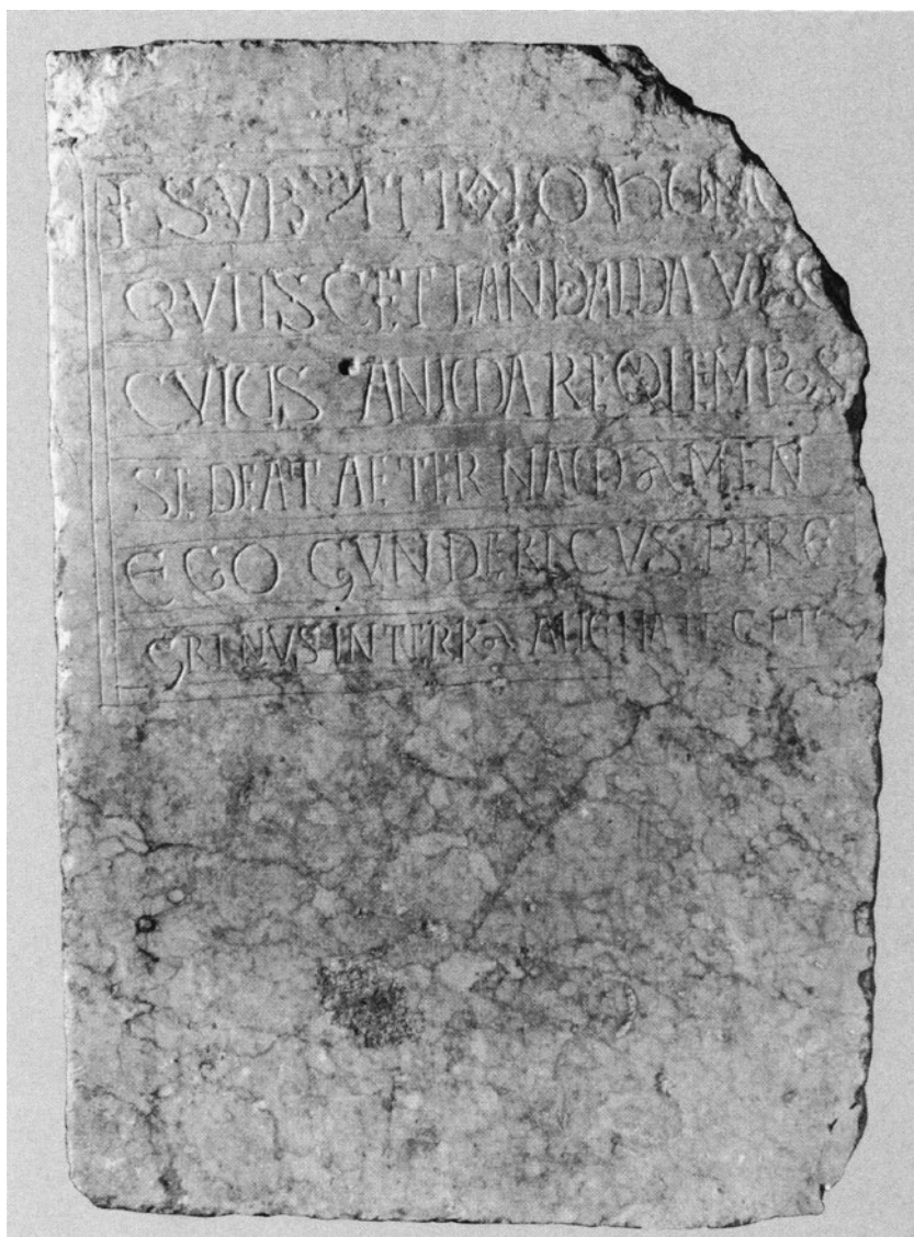
Fig. 1. Epitaffio di Landoalda (sec. VIII)