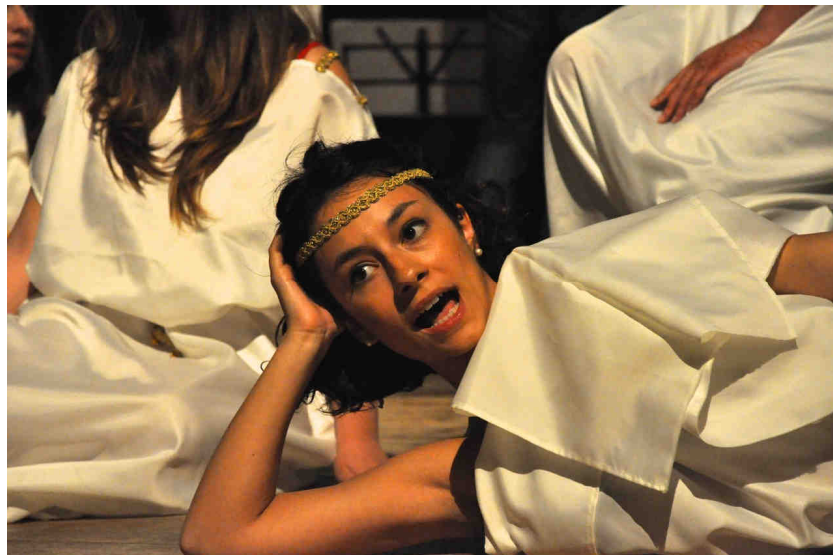
Fig. 9: Guerra senza fine a Venezia, col Liceo Marco Polo sulla scena

questi pensieri davanti a tutti sono una euergesia , un beneficio, e sono un contributo nella costruzione del bene comune 19 .