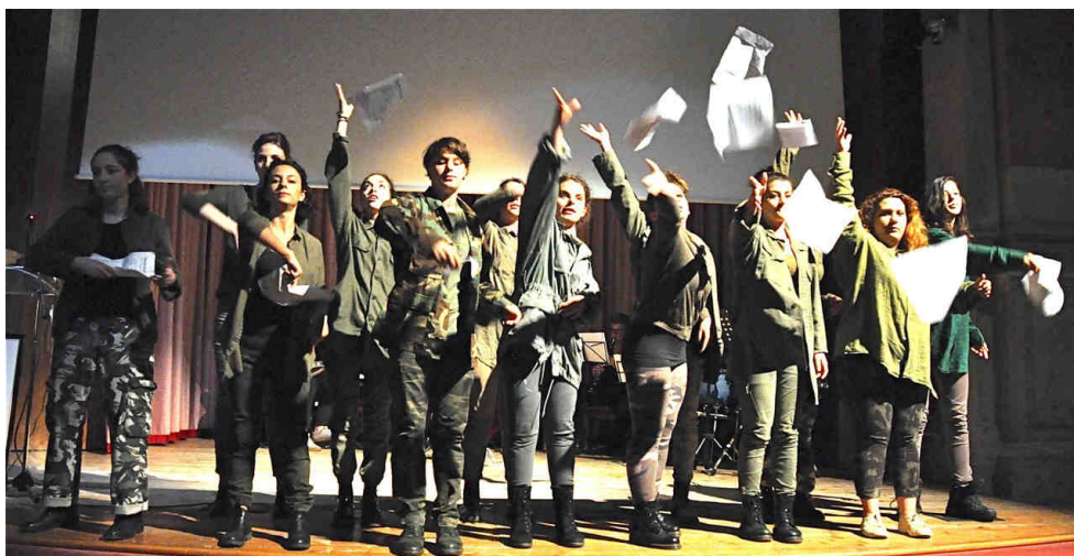
Fig. 10: Epea pteroenta finali del Liceo Marco Polo al Teatro di Santa Margherita a Venezia