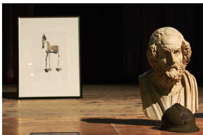
Fig. 1: L' Equus Troianus e Omero sulla scena del Teatro di Santa Margherita a Venezia

Che ci possa essere l'anniversario dello scoppio della guerra sembra perlomeno ambiguo. Forse sarebbe meglio ricordarne solo la fine. Se si parla poi troppo di una cosa nel nostro sistema mediatico, subito ti viene un sospetto. Ma se c'è un problema, non possiamo tirarci indietro, vogliamo guardare come stanno le cose. E non si deve tacere. I Classici Contro hanno nel loro spirito la parrhesia , la libertà di parola, di Socrate e del teatro di Dioniso del V sec. a.C. A guardare l'orizzonte e le linee dei monti, il fronte che sta tutto davanti ai nostri occhi, il pensiero c'è già: parleremo, allora, in tutti i teatri di tutte le città lungo questo fronte, e l'idea la chiamiamo Teatri di Guerra , che suona come il titolo di un film sull'ultima – ancora troppo vicina – guerra in Europa. Sempre con i classici in azione. Ma nelle nostre parole ci sono anche gli Uomini contro .