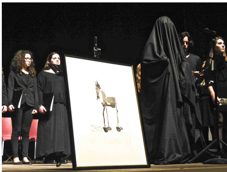
Fig. 6: Polemos e il Liceo Zanella in azione al Teatro Civico di Schio

L'unica cosa peggiore è forse la guerra civile, agghiacciante e incomprensibile (IX 64 πολέμου ... ἐπιδημίου ὀκρυόεντος), che merita la maledizione epica più dura per chiunque vi si avventuri o vi si ritrovi: non vi sono più fratelli, non più una casa, non più leggi umane e divine (IX 63 ἀφρήτωρ ἀθέμιστος ἀνέστιος). E questa, la guerra di cui parliamo, che continuiamo pericolosamente a chiamare "Grande Guerra", tra la celebrazione e il timore, solo ora riusciamo a comprendere che è stata la lotta fratricida dell'Europa, e ne ha preparato un'altra ancora più terribile.