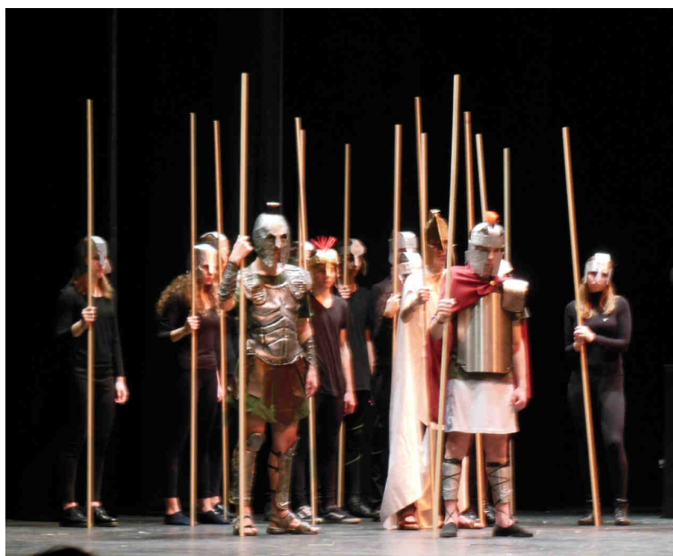
Fig. 7: I guerrieri achei del Liceo Stellini al Teatro Nuovo Giovanni da Udine