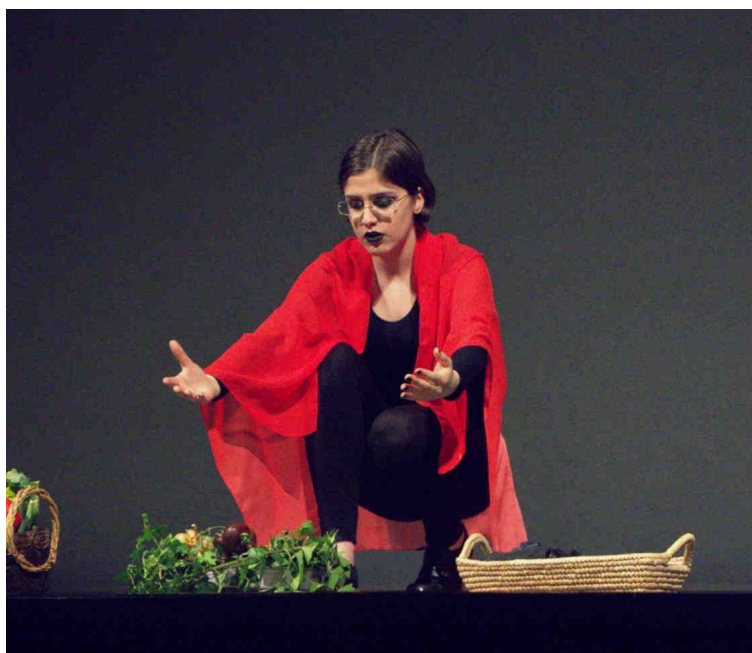
Fig. 8: Diceopoli e il Liceo Rosmini al Teatro Zandonai di Rovereto