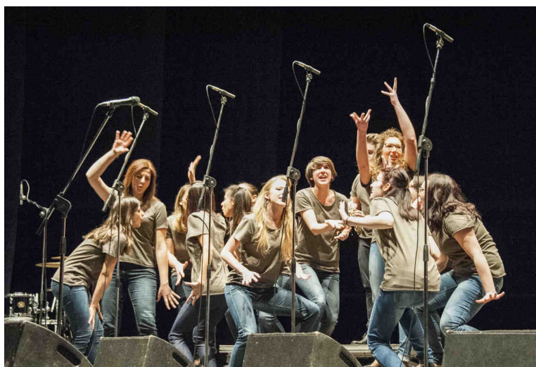
Fig. 3: Donne contro la guerra: il Liceo Dante Alighieri Gorizia in azione al Teatro Verdi