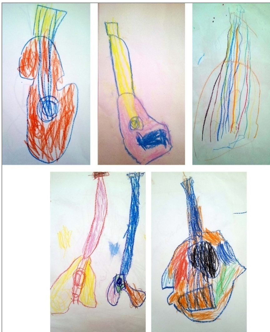
Fig. 3: Alcuni disegni dei bambini coinvolti nell'attività dell'ins. Q che ha condotto un Piano di Sviluppo Individuale di capacitazione dell'azione attraverso il coinvolgimento di competenze personali (es., di tipo musicale) finora mai attivate all'interno della professionalità educativa. L'attività ha permesso all'insegnante di esprimere la sua peculiarità educativa all'utenza in generale, migliorando la comunicazione in termini di autorevolezza professionale.