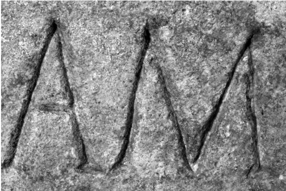
Fig. 2. Le ultime due lettere dell'iscrizione, il cui solco presenta tracce di rubricatura.

tra il II e il III secolo d.C. La frammentarietà del documento non consente peraltro interpretazioni sicure né per quanto riguarda la tipologia del monumento né per ciò che concerne gli esiti testuali. Si propone la seguente trascrizione interpretativa: