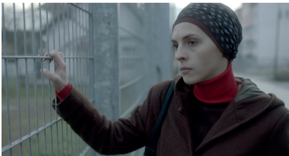
Figura 6. Immagine dal film Djeca (Children of Sarajevo)

sue varie forme (colorato, sciolto al vento, da indossare, da annodare, da bloccare sotto il mento ecc.), scandisce i momenti del film e il percorso di Alma nella riaffermazione di un proprio ruolo all'interno della piccola società del villaggio e nella costruzione di una nuova vita oltre il conflitto. L'hjia è uno degli elementi connotativi e simbolici anche del personaggio di Rahima in Djeca , qui il velo è il segno di demarcazione tra gruppi sociali, tra emarginati e socialmente accettati.