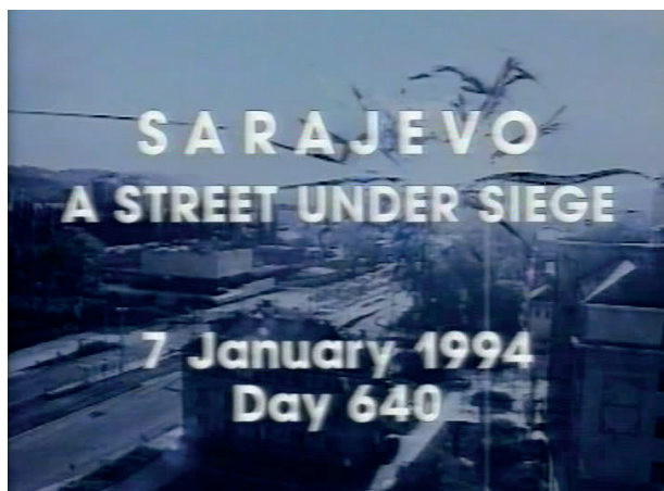
Figura 1. Immagine dal film A Street under Siege

anche alcuni attori britannici che però non poterono raggiungere la Bosnia in guerra. Pochi anni più tardi Obala Art Center e Miroslav Purivatra cominciarono l'avventura del Sarajevo Film Festival (241).