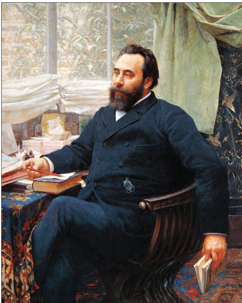
Sl. 14: Valtazar Bogišić (1834–1908) (Vlaho Bukovac, 1892: Wikimedia Commons).

(Sommières, 1820, 342), ki je ugotovil škodo na obeh straneh. Natančnega števila žrtev in ranjenih v tem sporu dokument ne navede, pojasni pa splošne značilnosti, ki smo jih že omenili, ter dodaja podatek, da je bila odškodnina za poglavarja ali duhovnika sedemkratna. Ko so poravnali medsebojne poškodbe in drugo škodo ( prebijanje ), je morala tista stran, ki je povzročila večjo škodo, npr. ubila enega človeka več, zanj plačati odškodnino. Sommières še pojasni, da se je njihov običaj ocenjevanja škode in določanja odškodnine izoblikoval že v zelo davnih časih ( un temps immémorial ) (Sommières, 1820, 344).