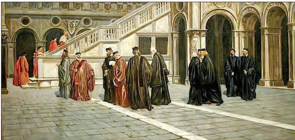
Sl. 9: Beneški Svet deseterice, t. i. Strašnih deset ( http://resetvenezia.it/2014/03/25/10-principi-per-una-buona-politica/ ).

vem prizadevanju po centralizaciji sodne oblasti v Republiki temeljno oviro predstavljala zlasti razvita mesta t. i. Terraferme , ozemlja, ki ga je Serenissima v pridobila leta 1420 po zlomu posvetne moči oglejskih patriarhov. Mesta kot Vicenza, Brescia, Treviso, Verona, Udine idr. so s svojimi statuti vztrajno branila avtonomijo in običaje, med temi predvsem sistem reševanja sporov (prim. Muir, 1998). Beneška republika običajno zakonodajno ni prepovedovala, temveč je svojo taktiko centralizacije pravosodja v državi postopoma uresničevala s prevzemanjem obrednih obrazcev maščevanja. Na prvem mestu je bil to izgon, nato pa tudi sklepanje premirja in miru, ki sta morala biti sklenjena vpricho beneških centralnih pravosodnih organov, zlasti Sveta deseterice, Štirideseterice za kriminal ( Quarantia criminal ) in Komunskih advokatov ( Avvogadori del Comun ) 34 ali njihovih pooblaščenecv, t.j. predvsem prek podestatov posameznih lokalnih skupnosti, ki so jih imenovali v beneškem Velikem svetu izmed svojih članov.