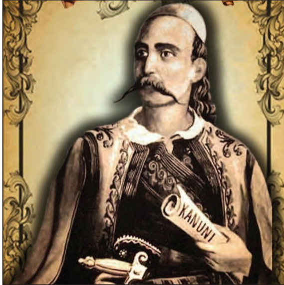
Sl. 11: Lekë III Dukagjini (1410–1481) ( http://www.irris.eu/images/adrion/dukagini.png ).

normativni akt sam. Je družbeno dogovorjeno, razumljeno in priznано početje, vselej gre za priznavanje oz. potrjevanje neke družbene vloge, naj si bo religiozne in/ali posvetne (prim. klasično delo Durkheim, 1995; Gluckman, 1962). Ne nazadnje, le pomislimo, s koliko raznovrstnimi rituali ima opraviti sodobna družba (Grimes, 2006).