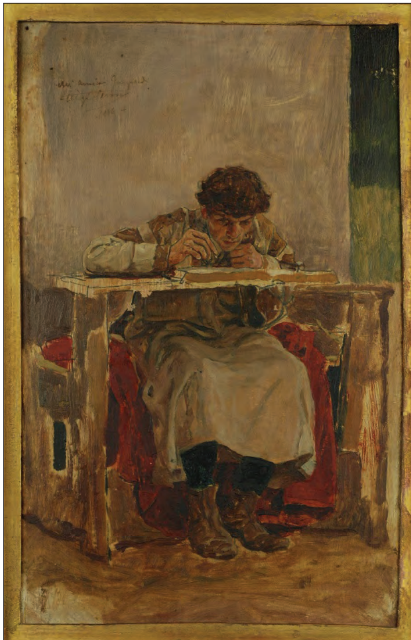
Sl. 6: Irnerij (1060–1130), velja za prvega glosatorja. ( Irnerio che glossa le antiche leggi , bozzetto di Luigi Serra, 1886, Collezione Stefano Pezzoli, Bologna).