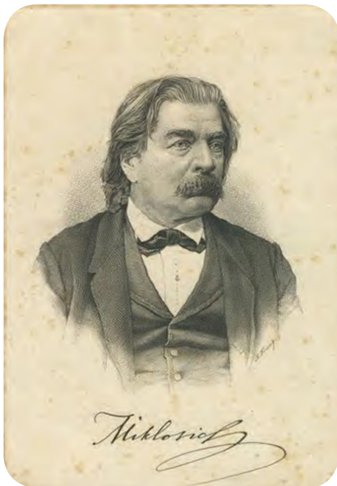
Sl. 13: Portret Franca Miklošiča (1813–1891) ( http://museums.si/sl/collection/object/233236/franc-miklosic ).

izpostavljale v ponižanju, kot kaže Jovanovičeva slika, temveč so tudi aktivno posegale v razreševanje konfliktov. Bogišičevi intervjuvanci nazorno opišejo primere, ko užaljena stran po več poskusih ni želela sprejeti priprošnjikov. Tedaj so se organizirali tako, da je na nek način v hišo užaljenega uspela priti ženska, ki se je nato samovoljno zategnila med verigo okoli ognjišča. Užaljeni bi jo v tem primeru moral iztrgati z verige, kar pomeni, da bi moral delati silo ženski, kar pa ni bilo častno. Zato jo je užaljeni moral sprejeti v hiši, kar je pomenilo, da je pristal na kompromis in začetek pogajanj (Bogišič, 1999, 365).