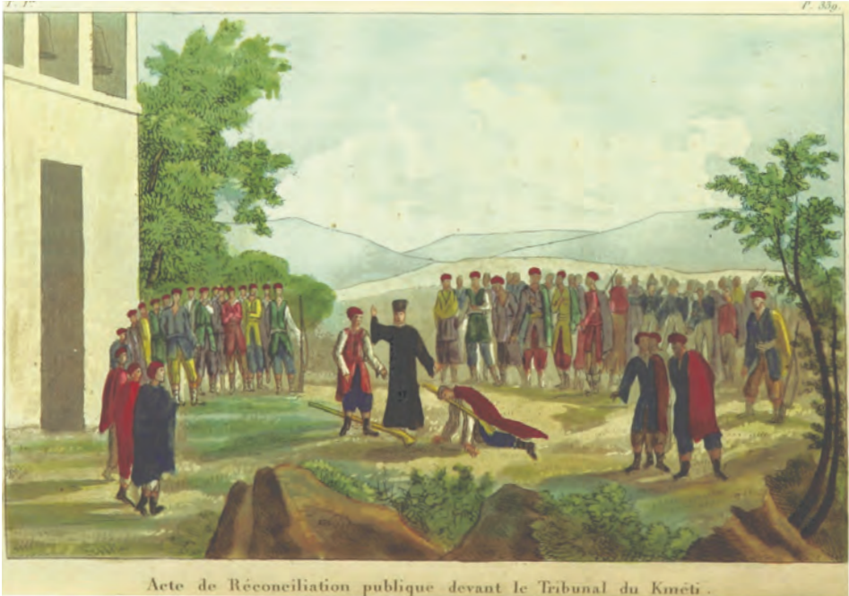
Sl. 15: Zaključna svečanost pomiritve v ritualu krvnega maščevanja v Črni gori (Sommières, 1820, 338).

Po odhodu iz cerkve so se mašniki razporedili v polkrogu v dve skupini, kmeti so stali ločeno od množice. Usmerjal jih je duhovnik (pop), ki je stal sredi prizorišča. Nato se je storilec počasi začel približevati nasprotni skupini, bos in razoglav, plazeč se po vseh štirih. Okoli vratu je imel obešeno dolgo puško. 47 Najprej je nastopila velika tišina, nato je posredoval pop, ki je sodišču pojasnil, da je storilec sprejel njihovo odločitev in se obrnil do užaljenega ter ga vprašal, če se odpove maščevanju in neprijateljstvu. »Užaljeni je bil razburjen, solze so mu polzele po licih, zamislil se je, pogledal v nebo, zavzdihnil, še vedno okleval, njegovo dušo, se zdi, je preplavilo tisoč različnih čustev.« Vsi prisotni so ga začeli nagovarjati in prositi, naj sprejme pomiritev, toda on je odgovoril, da še ni povsem pripravljen. Storilec je bil ves ta čas v poniževalnem klečečem položaju na vseh štirih.