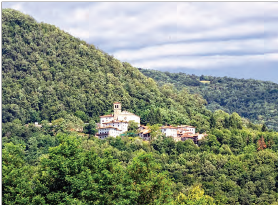
Sl. 1: Landar / Antro. Nadiške doline, Beneška ali Furlanska Slovenija (Mapio.net).

običajem sporazume glede njegovih pravic in pravnine oziroma odškodnine ( de iure et guadia suis ), med rodbinama pa zaradi tega primera ne sme prihajati do žalitev, kar pomeni, da naj med njima v prihodnje vlada mir. V kolikor bi katerakoli stran ali njihovi sorodniki v bodoče kršili ta mir, bi bili kaznovani s plačilom kazni v višini 50 zlatih dukatov, polovica kazni bi pripadala Landarskemu gastaldu, polovica pa oglejskemu patriarhu.