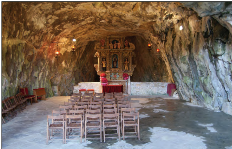
Sl. 3: Jama Sv. Janeza v Landarju, Provinca Videm (IT) (Wikimedia Commons, File:Grotta San Giovanni d'Antro 0904 I.jpg).

Poleg druge sodobne literature o ritualih (Muir, 2005, 12–14) in maščevanju pa si bomo pri interpretaciji pomagali še zlasti z Le Goffovim delom o simbolnem obredju vazalstva (1985), Schmittovimi Gestami v srednjem veku (1969) ter Petkovim Kiss of Peace (2003) z obsežno študijo geste poljuba miru, ki je imela kot del običajnega obredja pravno-legalni značaj.