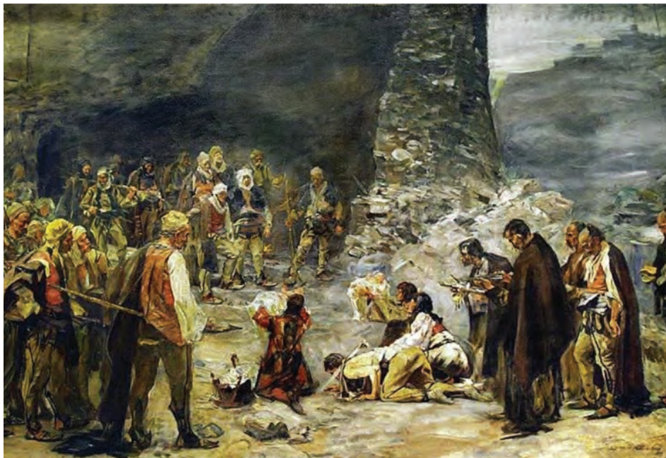
Sl. 12: Paja Jovanović: Umir krvi , 1899. Črna gora.

izluščimo iz virov in literature, je obred običajnega reševanja konfliktov potekal po naslednjih postopkih.