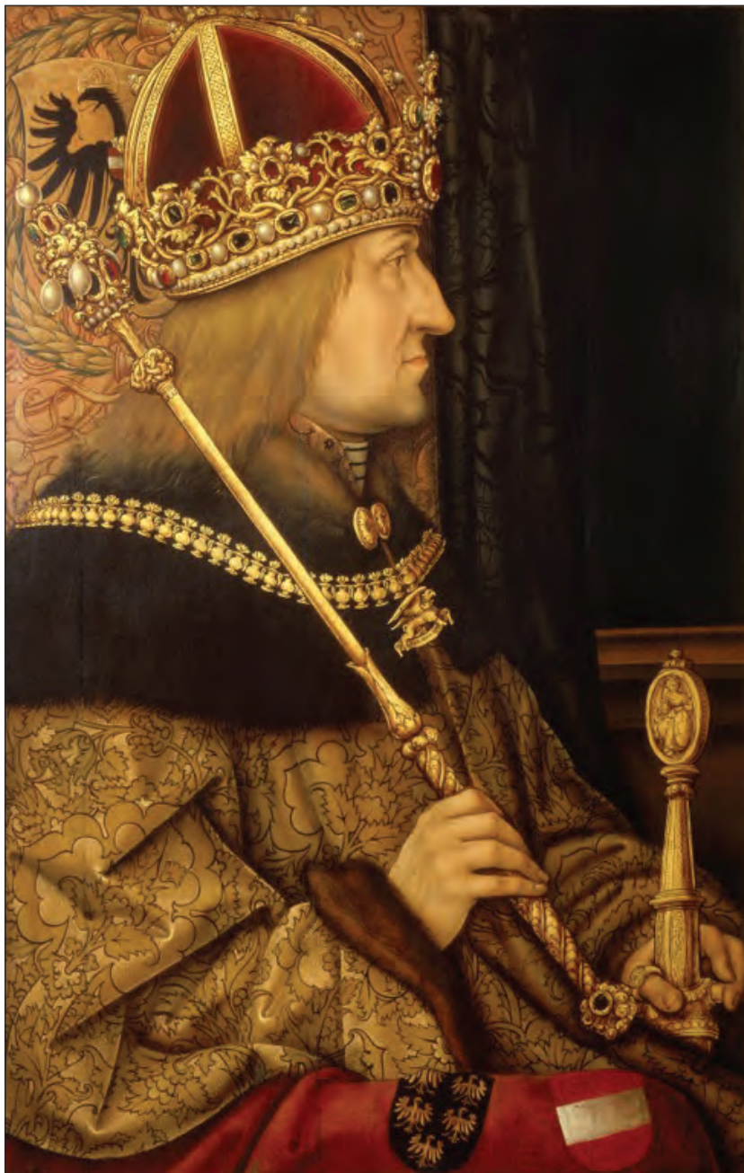
Sl. 7: Cesar Friderik III. (1415–1493). Hans Burgkmair, 1468.