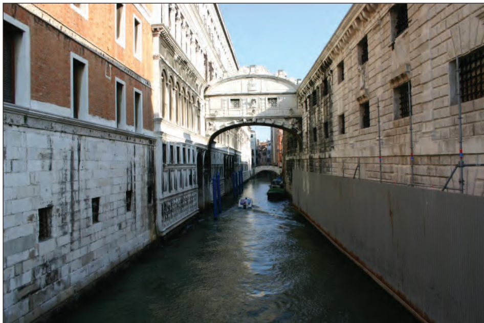
Sl. 10: Benetke, Novi zapori ( Prigioni nuove ) oz. Most vzdihljajev ( Ponte dei sospiri ), ki velja za most zaljubljenih, toda vzdihljali so se svojčas nanašali na zapornike.

v zaporu pri pristojnih organih, nemalokrat pa so jih zapeljali prav pred obličje Sveta deseterice, v beneške zapore.