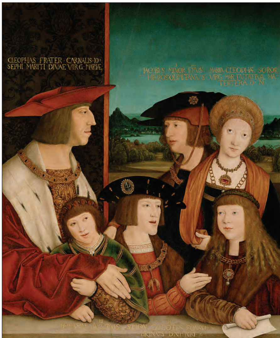
Sl. 8: Cesar Maksimilijan I. Habsburški in njegova družina; od leve Maksimilijan, vnuka Ferdinand in Karel, sin Filip, žena Marija in vnuk Ludvik (Bernard Strigel, po 1515:).

postopka. Pomiritev krvi oziroma uboja je bila z njuno vpeljavo predana iz rok sorodstva v roke sodnih oblasti. Dotlej so se slednje vmešale na zahtevo (npr. pokrik) ali zaradi neaktivnosti žrtvinega sorodstva, torej po akuzatornem postopku, načelu, da kjer ni