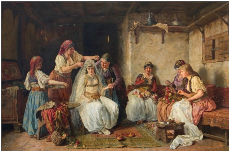
Sl. 5: Paja Jovanović, Okraševanje neveste (cca. 1885).

»Poročne usluge so seveda klasična oblika menjave v smislu družbene pogodbe«, zapiše Sahlins, toda ob tem dodaja, da je napačno mnenje, če v poročni menjavi vidimo popolnoma uravnovešeno menjalno situacijo, kajti pogosto se ena ali druga stran nezasluzeno in vsaj začasno okoristi. »Ta odsotnost natančnega ravnovesja je družbeno bistvena. Kajti neenaka korist vzdržuje zvezo, ki jo popolno ravnovesje ne bi moglo« (Sahlins, 1999, 273). 26