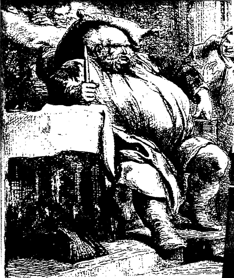
↑ J. Gilbert, Falstaff alla ostene (particolare) per Prince Henry 4 th , I