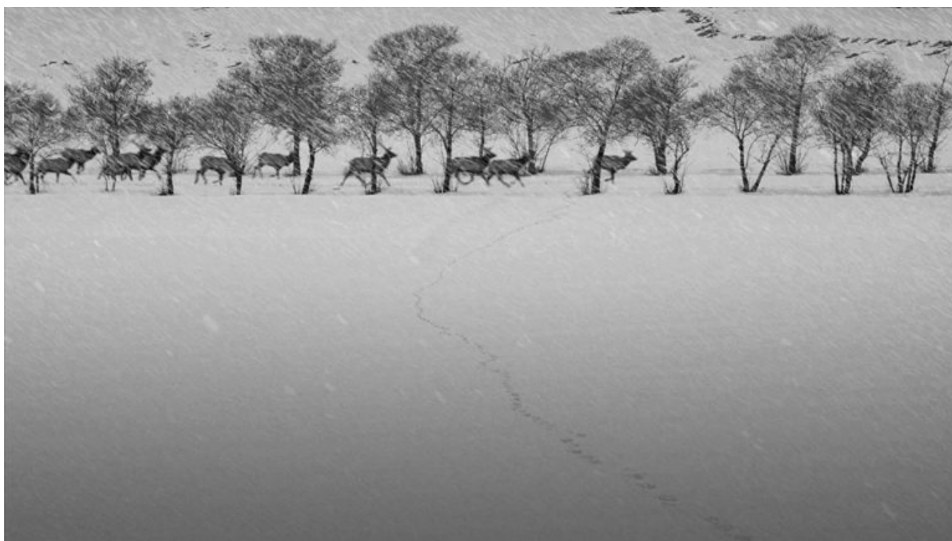
24 Frames (2017).