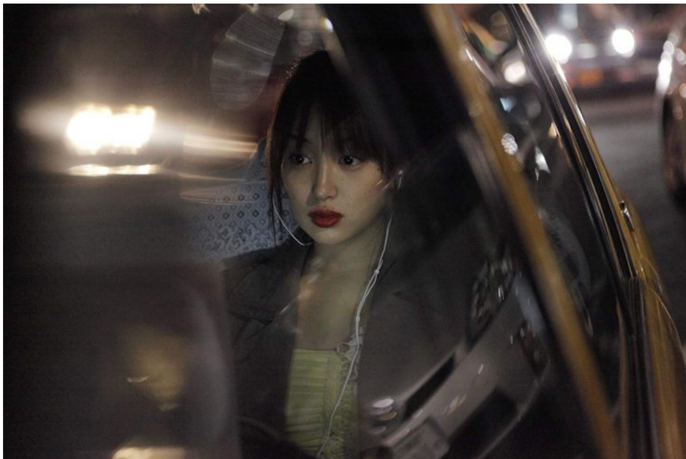
Qualcuno da amare (2012).

Uno spazio, occorre aggiungere, che trova continue allusioni nelle dinamiche evenemenziali dei due film e nelle loro singole immagini, ma che naturalmente deborda dalla superficie limitata dello schermo per catturare un mondo in fuoricampo che si impone attraverso improvvisi affioramenti. Tra le tecniche più amate da Kiarostami in questo senso c'è l'uso sofisticato degli specchi e delle superfici riflettenti, già visibile ai tempi de La ricreazione (1972) o Il viaggiatore (1974) e poi continuamente riproposto nei suoi film (iraniani) più noti. Il libro di Ugenti chiude il cerchio di questo percorso sperimentale tra “mostrazione” e “integrazione narrativa”, tra rifrazione e speculazione, concentrandosi sull'analisi di alcune sequenze di Copia conforme e Qualcuno da amare nelle quali i riflessi degli specchi catturano momenti fondamentali del racconto e permettono una più intensa restituzione della complessità delle relazioni umane (e di coppia in particolare), dimostrando come una soluzione propria di una cultura (lo specchio è un archetipo ineliminabile nella poesia sufi e nella cultura persiana in generale) possa ricondurre ad effetti interpretativi diversi quando collocata in altri ambienti geografici o mediali.