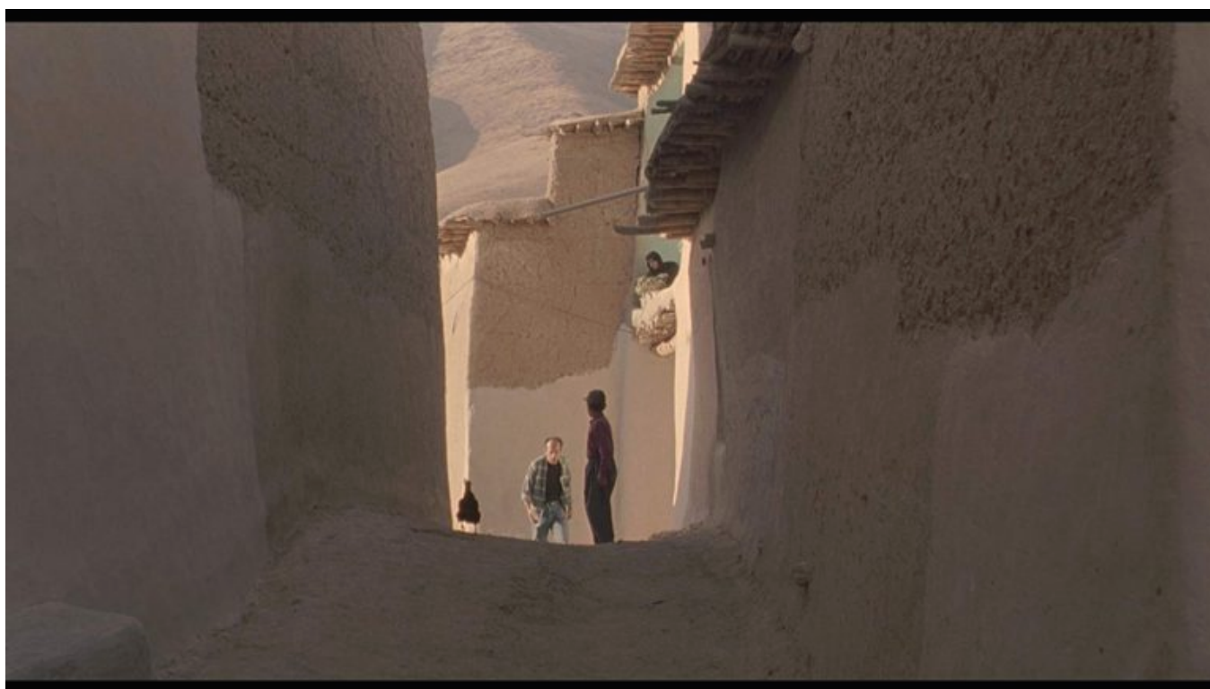
Il vento ci porterà via (1999).

Ugenti intuisce, prima di altri, la portata di novità di questo disseminarsi della presenza autoriale e dell'ambizione estetica in forme artistiche difficilmente riconducibili a un'unità e prova in un'operazione quasi vintage nel panorama delle pubblicazioni accademiche: vale a dire riconduurre questa difformità a un'unità più grande, più intensa, individuando un discorso coerente sulla forma delle immagini (da qui il sottotitolo del libro) che consente al regista iraniano di inventare un proprio stile «estendendo il proprio tratto oltre la specificità del medium [...] restituendoci un cinema che colpisce innanzitutto gli occhi, e rivendica la necessaria implicazione dello sguardo dello spettatore all'interno del suo tessuto formale» (p. 14).