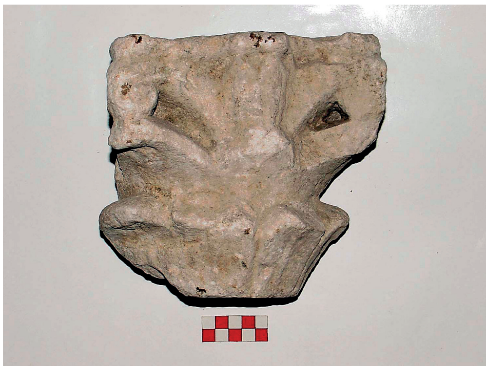
Fig. 4. – Capitello, Torcello, Museo, deposito, inv. 217 (Città Metropolitana di Venezia-Museo di Torcello).

Soluzioni analoghe a questo gruppetto torcellano si possono riscontrare invece ad Aquileia (11) e Müstair. In particolare nell'insieme di materiali altomedievali dell'importante monastero alpino sono emersi capitellini con misure e concezione similari, databili alla fine dell'VIII-inizio IX secolo (12) . Alcuni presentano un solo giro di foglie, ma almeno tre – conservati integralmente e organizzati su tre registri, con due corone di foglie lisce – sono vicinissimi alle forme dei capitelli di Torcello (13) .