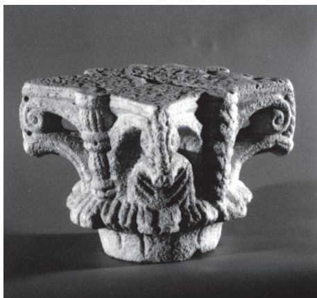
Fig. 5. – Capitello, Torcello, Museo, deposito, inv. 1 (Città Metropolitana di Venezia-Museo di Torcello).

Nel gruppetto appena esaminato si può inserire anche un altro capitello del museo di Torcello (fig. 5) che rappresenta una variazione del tipo: le due corone di foglie sono diversificate (lisce e aggettanti in sommità, con solchi profondi nel risvolto nel primo giro, appuntite e con solchi lungo lo spessore e nel corpo a definire le nervature nel secondo giro) ma soprattutto le eleganti volute del terzo registro sono liberate dal traforo e unite agli angoli dove si accostano a elementi a cordoncino che collegano l'abaco e le sottostanti foglie aggettanti (14) . Inoltre, al centro di ogni prospetto, anziché il