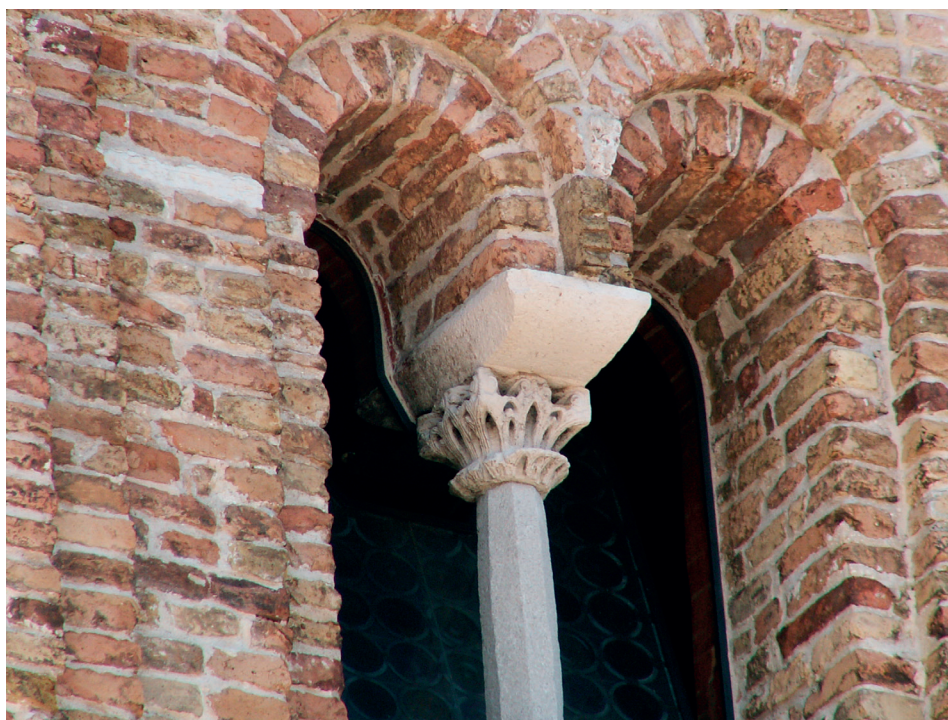
Fig. 8. – Bifora con capitello altomedievale, Murano, SS. Maria e Donato, facciata ovest (foto Autore).

Si propone quindi – anche per questo capitello – una datazione al IX secolo.