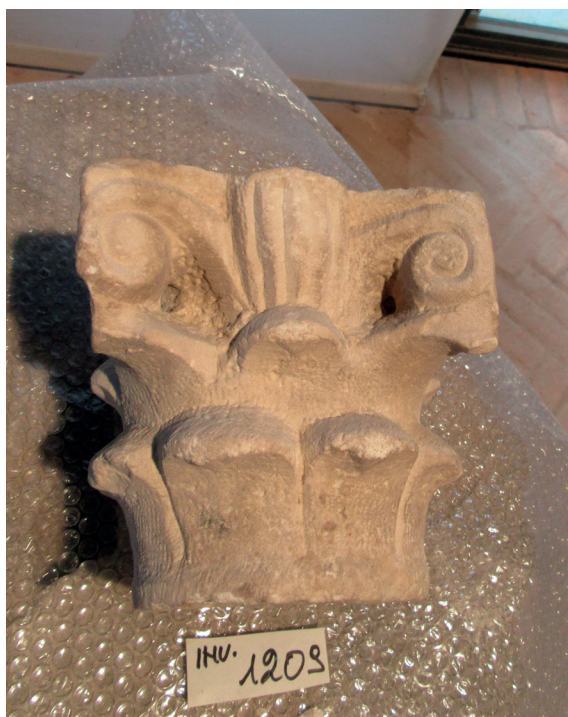
Fig. 2. – Capitello, Torcello, Museo, deposito, inv. 1209 (Città Metropolitana di Venezia-Museo di Torcello).

mulazione di oggetti pertinenti non solo alla cattedrale, ma anche all'isola e alla laguna settentrionale. Le revisioni successive delle numerazioni impediscono di correlare con certezza capitelli, pulvini, plutei, trabeazioni a un edificio, ma essi comunque attestano (in qualche caso) gruppi coerenti, attribuibili a momenti produttivi non occasionali.