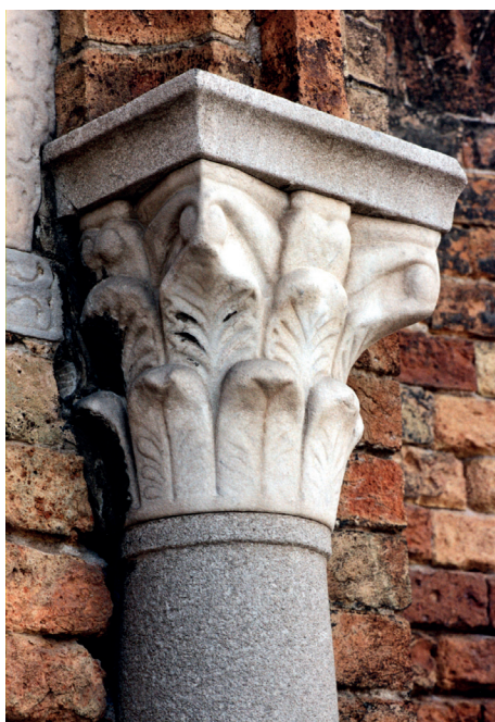
Fig. 11. – Capitello, Murano, SS. Maria e Donato, facciata absidale est, da laterale nord, piano terra, secondo capitello a destra.

Leo di Montefeltro (55) , fino ai capitelli già richiamati del ciborio di Zara (S. Toma) (56) e di Berlino (57) . Quest'ultimo anche se di maggiori dimensioni (h. m 0.38) presenta particolari affinità anche nella struttura, combinando però le soluzioni ad archetti ogivali attestate nel capitello della facciata di SS. Maria e Donato e in quello della Canonica. Conoscendo solo la generica provenienza da Venezia nel 1902 non si può agganciarlo con certezza all'insieme muranese con cui presenta notevoli affinità. L'abaco, infine, presenta profilo mistilineo e doppio listello mentre il collarino alla base è un semplice listello piano non emergente.