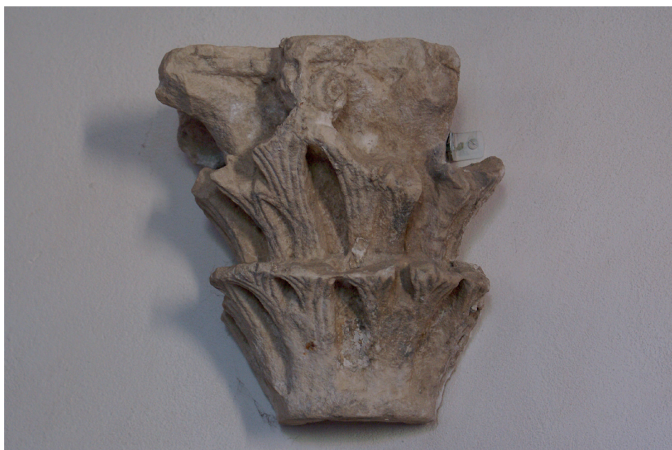
Fig. 9. – Capitello frammentario, Murano, SS. Maria e Donato, Museo della Canonica.

di foglie con le sottili solcature parallele e le cavità ogivali, è la stessa del capitello in opera in facciata, conservando meglio il primo giro, mentre restano nel terzo registro solo due piccole volute convergenti al centro del prospetto. L'angolo è danneggiato leggermente, ma qui la soluzione sembra affidarsi a una variante: una foglia allungata e appuntita, piuttosto che le volute.