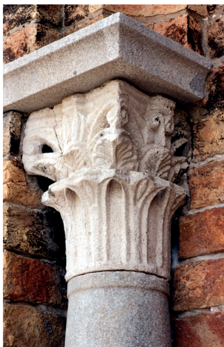
Fig. 10. – Capitello, Murano, SS. Maria e Donato, facciata absidale est, ala laterale sud, piano terra, secondo capitello da sinistra.

cui una data al papato di Adriano I (36) il che permette di ribadire la datazione al IX sec. dei capitelli aquileiesi (37) .