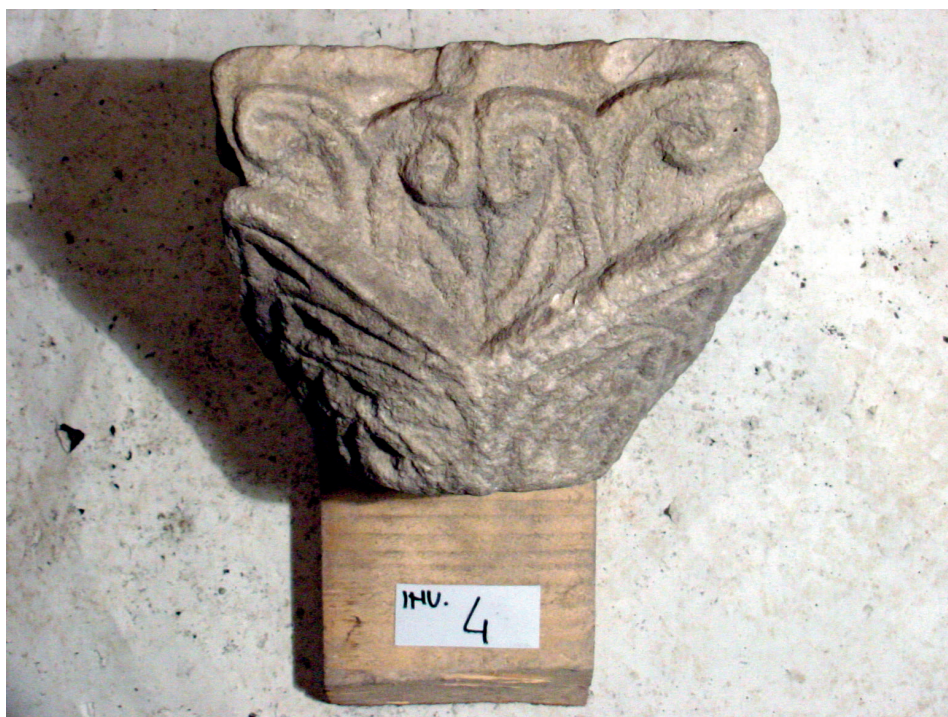
Fig. 6. – Capitello, Torcello, Museo, deposito, inv. 4 (Città Metropolitana di Venezia-Museo di Torcello).

glie accostate agli angoli, con zone d'ombra geometriche in successione, in un tentativo di riprendere forme di esecuzione controllata della produzione normalizzata bizantina, già sperimentata a Cividale (19) e perseguita anche in un frammento jesolano (20) , la cui formulazione – ambigua e ambivalente – è giocata sulle linee parallele delle nervature e sugli incavi che, insieme, disegnano foglie impossibili. La zona cubica superiore accoglie volute estremamente sommarie e ineleganti: non è possibile quindi associare questo capitello al gruppetto già considerato, poiché se ne distanzia per lavorazione, impaginazione e struttura.