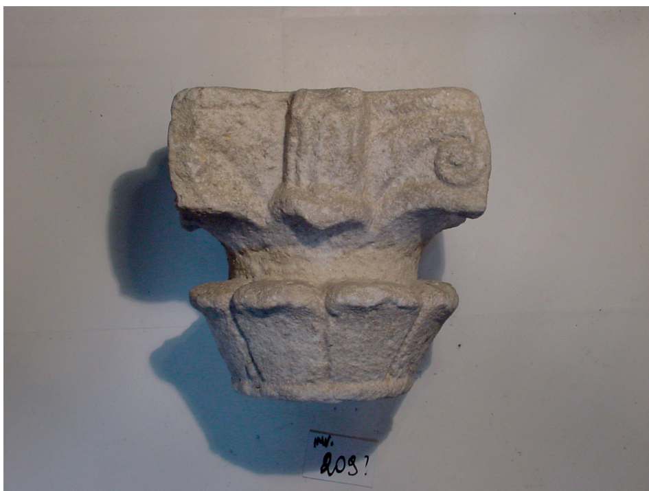
Fig. 3. – Capitello, Torcello, Museo, deposito, inv. 209 (Città Metropolitana di Venezia-Museo di Torcello).

replicata nei capitelli inventariati con i numeri 209 (8) e 217 (9) (figg. 3-4) che hanno misure avvicinabili e una simile disposizione su tre registri, variando solo nella definizione delle foglie del primo registro inferiore che nel capitello inv. 217 presenta una piccola nervatura centrale. Nel confronto istituito da Cattaneo si può cogliere la diversità dell'esemplare torcellano nell'organizzazione su tre registri; è l'unico infatti a giocare sugli effetti del progressivo aumento delle foglie e del relativo ampliamento dimensionale. Capitellini cubici a foglie lisce sono attestati in tutta Italia, ma prevalentemente si riscontrano esemplari giocati su due registri: un solo giro di foglie e un elemento cubico sommitale solitamente occupato da volute convergenti (10) .