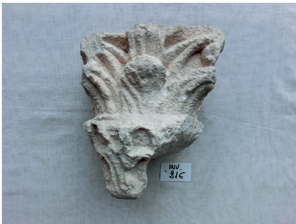
Fig. 7. – Capitello, Torcello, Museo, deposito, inv. 216 (Città Metropolitana di Venezia-Museo di Torcello).

costamenti delle punte di foglie determinano zone d'ombra triangolari in successione creando effetti di archeggiature tra le foglie del primo registro, raffrontabili con due capitelli muranesi che vedremo. La seconda corona invece presenta altri due tipi di foglie: al centro del prospetto una foglia tondeggiante con solchi che disegnano le nervature e una struttura a piuma di pavone mentre agli angoli convergono elementi tubolari che potrebbero riferirsi a foglie appuntite. Per le prime si possono richiamare i capitelli delle cripte di Treviso (22) e Aquileia (23) , che presentano la stessa conformazione (24) , mentre per le seconde si possono indicare alcuni raffronti: alcuni capitellini di S. Leo (25) e un capitello della cripta di Aosta (26) .