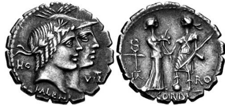
FIG. 2 - RRC 403. Classical Numismatics Group, Inc. ( www.cngcoins.com ), inventory number: 944650.

Spartiti sulle facce delle monete compaiono anche i nomi dei due triumviri monetali responsabili di questa emissione: KALENI e CORDI, rispettivamente sul diritto e sul rovescio. Entrambi gli elementi onomastici possono essere interpretati sia come gentilicia che come cognomina (6) ; tutta-