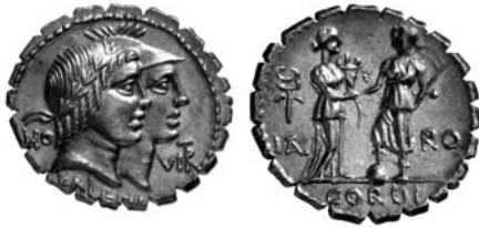
FIG. 1 - RRC 403.

(legende: ITAL e RO), colte mentre si rivolgono l'una verso l'altra porgendo le destre in una stretta; con la sinistra, Italia reca una cornucopia (2) , mentre la figura di Roma, coronata d'alloro, regge una hasta (3) e poggia il piede destro su un globo. La scena è con grande verosimiglianza un'allusione alle procedure censitarie del 70/69 a.C. (4) , grazie alle quali i novi cives vennero definitivamente integrati nella comunità civica e politica romana (5) .