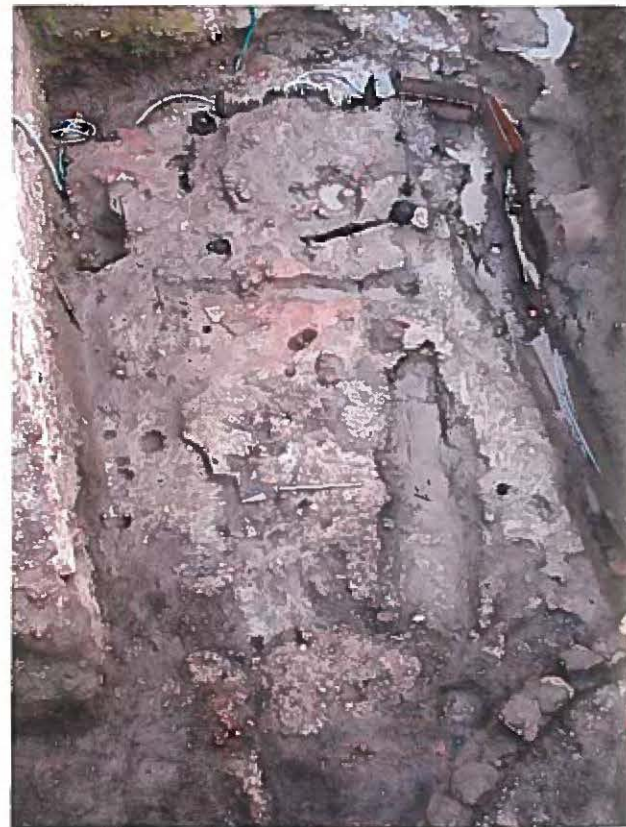
Le strutture produttive, scavo di Piazza XX Settembre.

The elements linked to production are represented by the use of well-structured fires in one phase and new structures in another. The first phase, which is