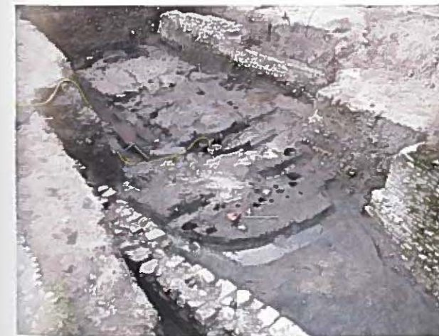
Atelier produttivo: la canaletta di scolo esterna.

represented by metallurgic production and semi-finished metals has two fire points (a real kiln, delimited by a sector made of bricks, and a fireplace in the centre of the room). A wooden quadrangular structure in association with the fires is around 2x2 metres and was constructed by driving tall angular poles within the ground, enclosed on four sides with wooden boards. This well-preserved structure was probably a cooling vat for transforming the metallic products. Iron wasters and pithoi for storing coal are also present. Numerous marks from working tools can be made out on the artificial clay floor, which was used as a pavement.