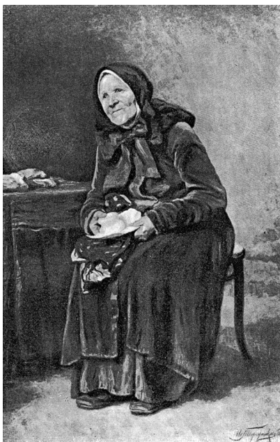
Fig. 6. Ivan Tvorozhnikov, Dio vi conceda la sua grazia , olio su tela, collocazione ignota