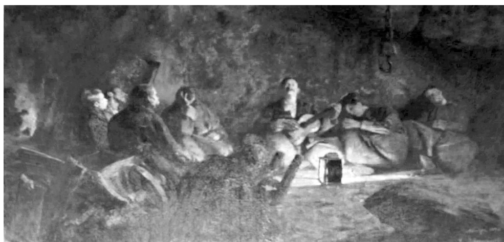
Fig. 2. Vladimir Šereševskij, La canzone della Patria , 1893, olio su tela, cm 240x424, Galleria Internazionale d'Arte Moderna, Ca' Pesaro, Venezia