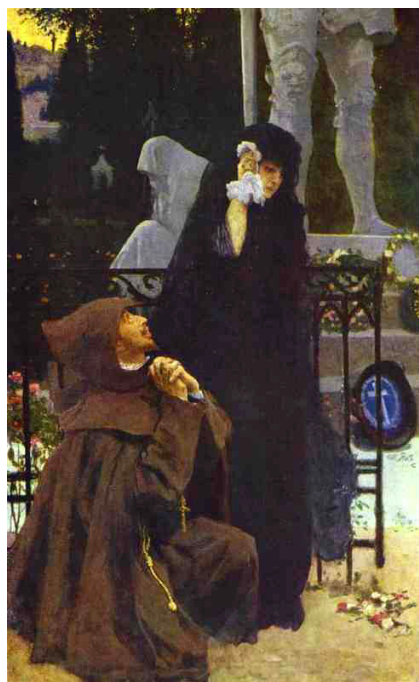
Fig. 4. Il'ja Repin, Don Giovanni e Donna Anna , 1887-1896, olio su tela, cm 202x124, Museo Nazionale Puškin, San Pietroburgo