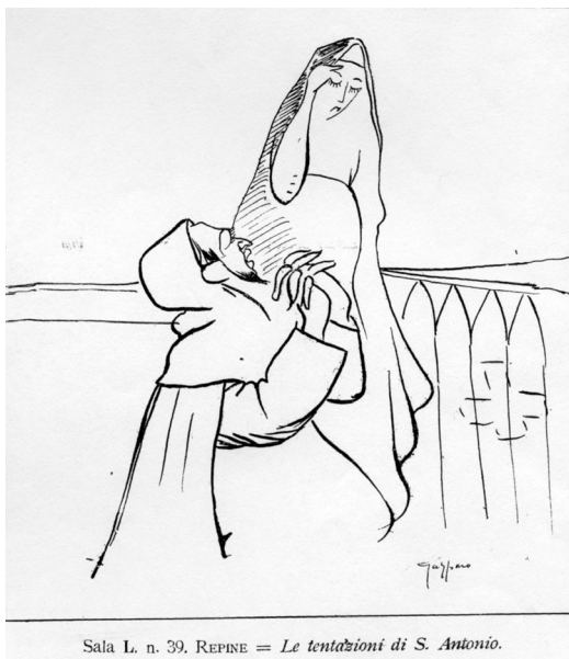
Sala L. n. 39. REPINE = Le tentazioni di S. Antonio .