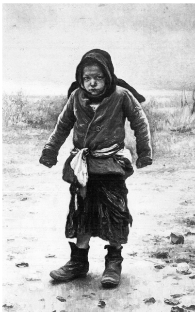
Fig. 7. Ivan Tvorozhnikov, Una ragazzina , olio su tela, cm 125x68, Galleria Internazionale d'Arte Moderna, Ca' Pesaro, Venezia