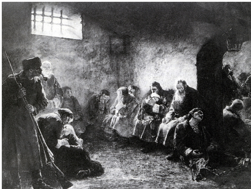
Fig. 1. Vladimir Šereševskij, Una tappa di deportati in Siberia , 1893, olio su tela, cm 272x355, Galleria Internazionale d'Arte Moderna, Venezia