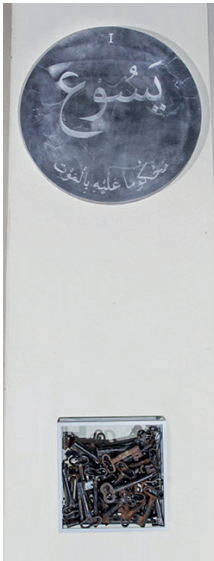
Figure 1 Emily Jacir, Via Crucis . 2016. Station I: Jesus carries his cross