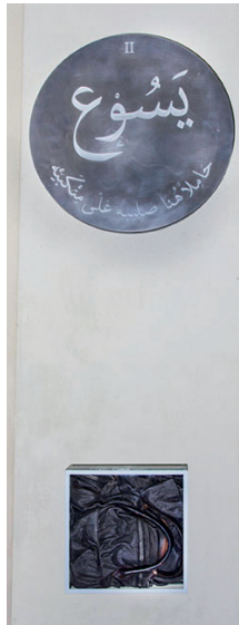
Figure 2 Emily Jacir, Via Crucis . 2016. Station II: Jesus is condemned to death