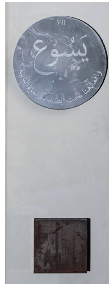
Figure 3 Emily Jacir, Via Crucis . 2016. Station VII: Jesus falls the second time

tile of azure glass blown in Venice recalls the colour of Mary’s veil in western iconography. The semi-circle begins with the rusty “keys from Palestinian homes” and ends with a tile of rusty iron in Station VII: Jesus falls for the second time . A slab of rusty iron. Political prisoners, children prisoners. Prisoners [fig. 3]. The caption in the catalogue reads: “iron always rusts” (Jacir 2016, 53).