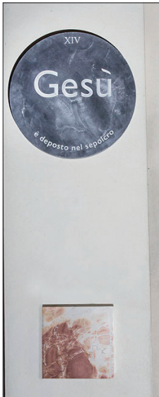
Figure 4 Emily Jacir, Via Crucis . 2016. Station XIV: Il corpo di Gesù è deposto nel sepolcro / Jesus is laid on the tomb

As Lansdowne points out, the “thinginess” (Lansdowne 2016, 9) of Jacir’s objects is perhaps stronger in the artifacts created for the installation, because the materials she chooses – the piece of olive wood, marble as part of the land, cement, iron – do not by themselves convey sacredness until they are understood in the cultural terms that make them unique for an individual or a community. The last station, the one that commemorates Jesus being laid in the sepulchre for instance, is a slab of red slayeb marble from Bayt Jalla, from the quarries now inaccessible to the local Christian community since they have been incorporated into the Israeli settlement of Gilo (MacEvitt 2016, 107-8). The red and bloody colour of the marble associated with the caption in the book – Right to be buried in our homeland. Palestine – is particularly touching for a modern viewer [fig. 4].