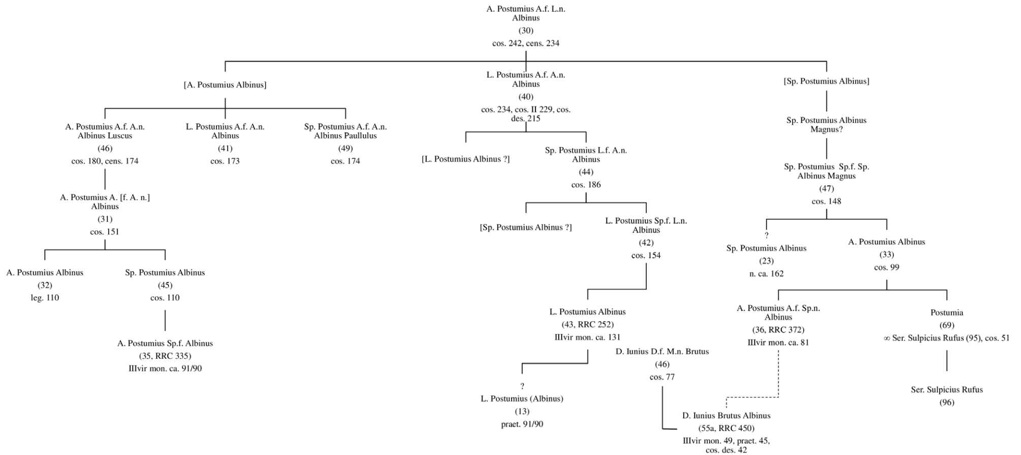
Abb. 1. Stammbaum der Postumii Albini. Abbildung erstellt von M. ZANIN (im Druck 2 ) für Hermes .