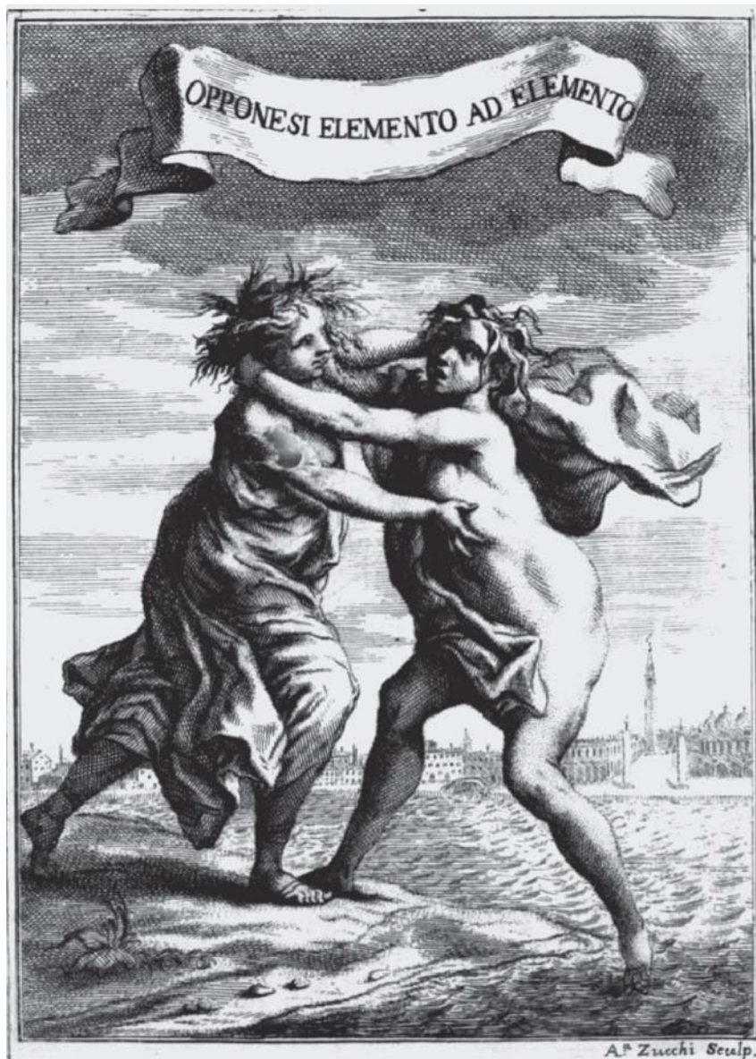
Fig. 2 - Il frontespizio del trattato Della Laguna di Venezia (TREVISAN 1715).