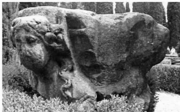
Fig. 1 - Verona, Giardino Giusti, capitello figurato, lato sinistro