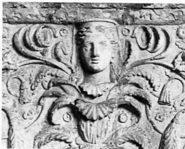
Fig. 7 - Copenhagen, Ny Carlsberg Glyptotek, lastra Campana con Ceres

cilmente verificabile, e l'integrazione potrebbe dipendere da una errata interpretazione dei riccioli. L'attributo del kalathos posto sul capo può eccezionalmente comparire in relazione a Tellus , come mostra ad esempio un noto mosaico di IV secolo di una domus di Apamea 19 . Ma è anche un attributo di Ceres , con la quale spesso Tellus è assimilata e divide un ruolo di primissimo piano nel culto e nella propaganda imperiale (Fig. 7) 20 . Lo stretto rapporto che intercorre tra la dea delle messi e Terra mater è documentato tra l'altro da espliciti rimandi nelle fonti letterarie 21 , dalla contiguità delle rispettive feste nel calendario religioso romano, e da una serie di iniziative culturali dedicate congiuntamente alle due divinità, che vanno dalla festa delle sementivae – su cui sempre Ovidio nel passo ora citato ( Ov. Fasti I, 657-696) – ai Cerealia 22 . Dall'età augustea Ceres diviene al pari di Tellus strumento della propaganda politica ed una delle figure di riferimento nell'assimilazione a divinità e personificazioni di imperatrici e altri personaggi femminili della casa imperiale; la sola documentazione numismatica e scultorea sull'associazione tra Livia e Ceres è sufficiente per dare