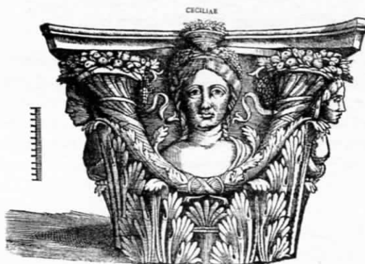
Fig. 4 - G. Caroto, incisione con capitello

parete. Al centro di ciascun lato è scolpito un busto femminile circondato da nastri svolazzanti. Lo stato di conservazione non permette di valutare i motivi angolari, che in base all'incisione del Caroto sono ricostruibili con cornucopie collegate sull'asse di ciascun lato da nastri intrecciati.