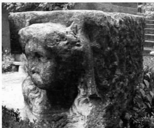
Fig. 3 - Verona, Giardino Giusti, capitello figurato, lato destro