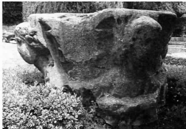
Fig. 2 - Verona, Giardino Giusti, capitello figurato, lato centrale