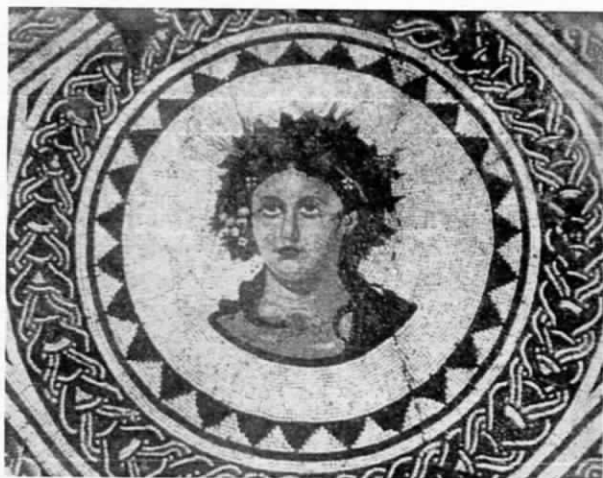
Fig. 6 - Siviglia, Museo Archeologico, mosaico con Tellus