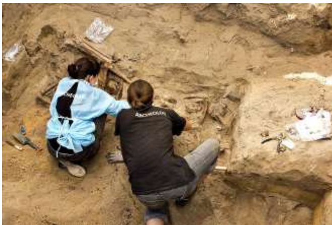
Operazioni di riesumazioni nel sito detto Łacząka, nel contesto del cimitero militare Powązki di Varsavia ( https://ipn.gov.pl/pl/dla-mediow/komunikaty/12127,Prace-IPN-na-powazkowskiej-Lacze-w-pytaniach-i-odpowiedziach-FAQ.html )

Le riesumazioni assumono dunque un ruolo centrale nella produzione contemporanea di memoria in Polonia, in relazione ai fatti di Katyń, cioè ai massacri operati dai sovietici nei confronti dell'élite polacca nell'aprile e maggio del 1940. Oltre a ciò, le riesumazioni hanno riguardato nel 2001 anche Jedwabne e i dibattiti circa il collaborazionismo polacco con i nazisti e l'antisemitismo popolare in Polonia. Si riscontra inoltre un evidente incremento tra il 2012 e il 2017, legato alle iniziative di indagine e scavo coordinate da un ufficio apposito dell'Istituto Nazionale della Memoria, che contempla un'ampia partecipazione di volontari, e che mira a individuare e recuperare le vittime del regime comunista polacco del periodo tra il 1944 e il 1956, (dis)seppellite nel cimitero militare Powązki di Varsavia.