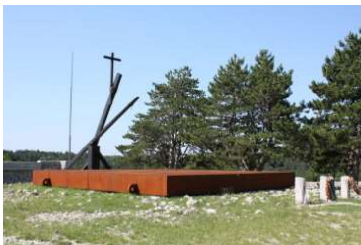
Il monumento presso la foiba di Basovizza ( https://www.percorsiprovinciats.it/home/dettagliomap/503 )

Chi visiti il complesso memoriale della foiba di Basovizza incontrerà un monumento posto nel 2007 sulla foiba, composto di un'enorme carrucola, sovrastata da una croce, agganciata a un imponente cofano di metallo. Se la carrucola simboleggia l'estrazione dei corpi, il pesante cofano, 10 metri per 10, nelle intenzioni dell'autore vuole richiamare le coperture borchiate dei pozzi e delle cisterne del territorio. È quindi un vero coperchio, che chiude la foiba, seppur in tensione ideale con la carrucola.