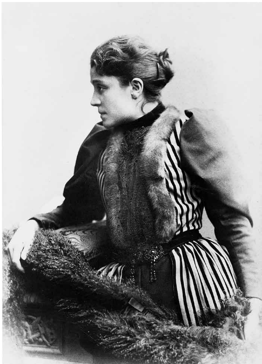
Eleonora Duse, foto Guigoni & Bossi, 1890 ca. Fondazione Giorgio Cini, Istituto per il Teatro e il Melodramma, Archivio Duse