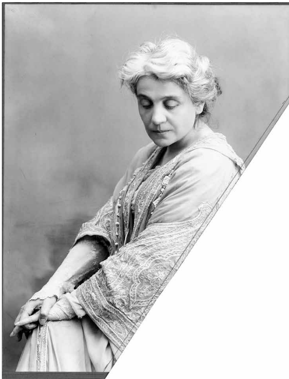
Eleonora Duse