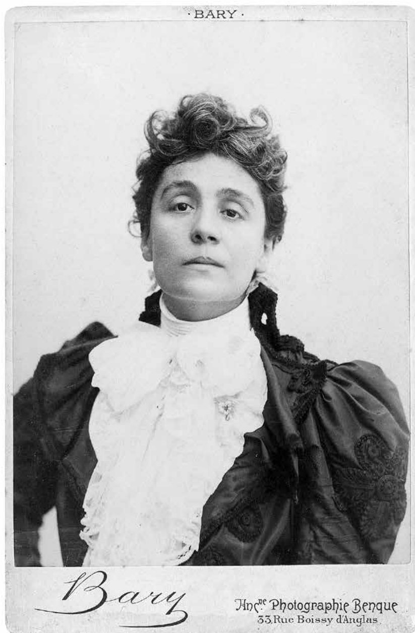
Eleonora Duse, foto Bary, 1900 ca. Fondazione Giorgio Cini, Istituto per il Teatro e il Melodramma, Archivio Duse