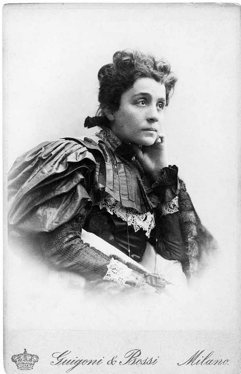
Eleonora Duse, foto Guigoni & Bossi, 1890 ca. Fondazione Giorgio Cini, Istituto per il Teatro e il Melodramma, Archivio Duse