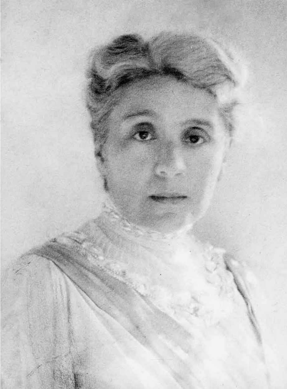
Eleonora Duse, 1910 ca.