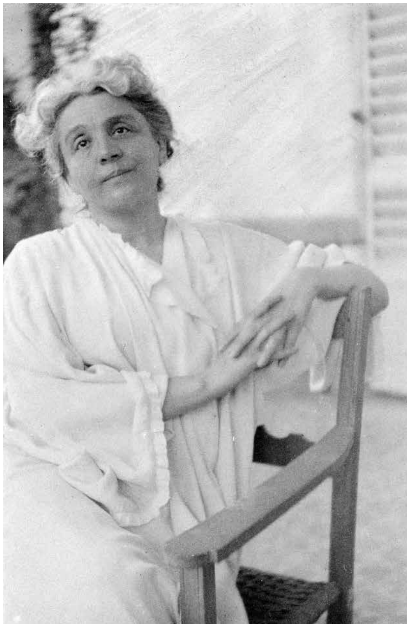
Eleonora Duse, 1910 ca.