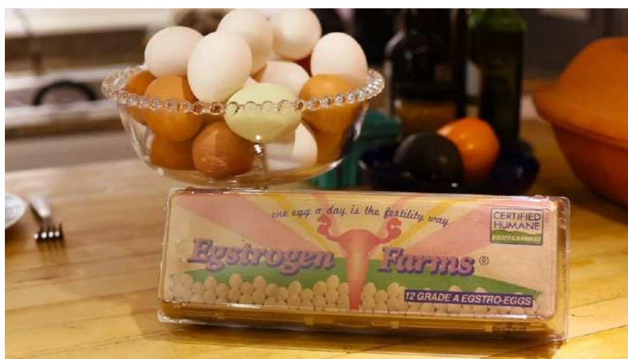
Fig. 04. Mary Maggic Tsang, Egstrogen Farms , progetto multimediale, dettaglio, 2015

Egstrogen Farms (2015) è un finto video promozionale realizzato da Mary Maggic Tsang per un'ipotetica compagnia che produce le Egstro-Eggs, uova provenienti da galline geneticamente modificate, biologiche e allevate all'aperto, "addizionate" però con gonadotropine (ormoni che regolano la produzione ovarica). Per questo lavoro l'artista si richiama ai lavori del collettivo subRosa, uno dei primi gruppi di attiviste femministe a lavorare sul legame economico-politico fra il corpo delle femmine umane e non, il lavoro riproduttivo e le nuove tecnologie, che ripercorre soprattutto attraverso il teatro situazionale le reti in cui si intrecciano interessi e ideologie proprietarie, eugenetiche e colonialiste della ricerca medica 22 , della zootecnia e dell'industria agro-alimentare (Fig. 04).