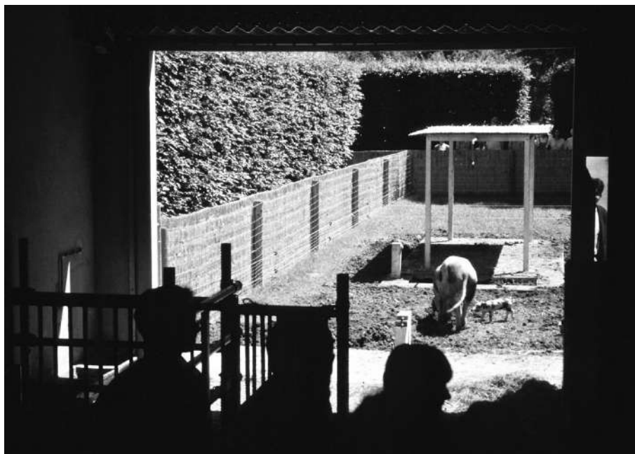
Fig. 03. Rosemarie Trockel e Carsten Höller, Ein Haus für Schweine und Menschen (A House for Pigs and People), dettaglio della installazione alla Documenta di Kassel, 1997.

pagnano il lavoro), e gioca sullo straniamento che l'immagine dei maiali, apparentemente una still life , suscita quando gli "spettatori" si accorgono dei loro movimenti, pur nella mancanza di contatto sonoro e olfattivo fra le due parti (Fig. 03).