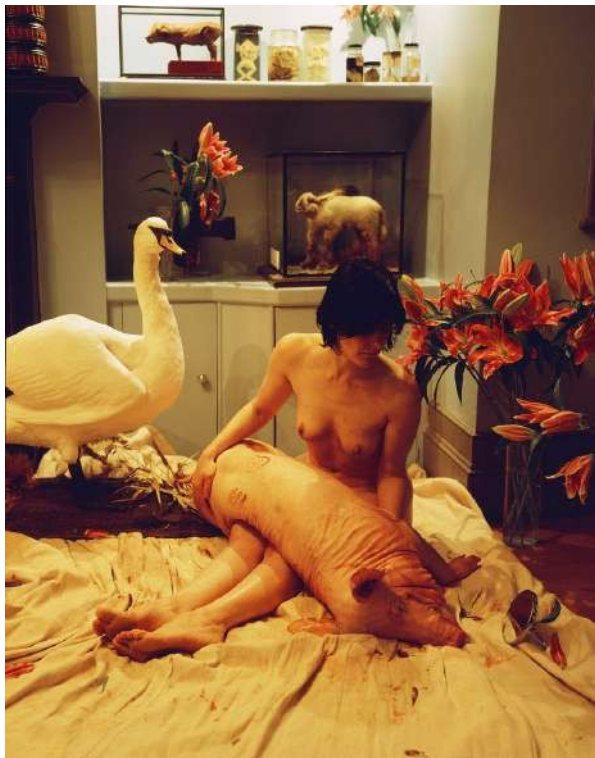
Fig. 05. Kira O'Reilly, inthewrongplaceness , performance, Newlyn Art Gallery, Penzance, UK, 2006

Nel corso di una residenza a SymbioticA (2003-04), la performer Kira O'Reilly studia le tecniche di coltura artificiale di cellule animali per il suo progetto Marsyas – Running out of Skin (2003-2004), teoricamente finalizzato a una coltura dei propri stessi tessuti (poi non realizzata). Il progetto finale è anticipato da sette azioni realizzate nel corso degli anni precedenti 29 . Nell'ottava azione, che si svolge in laboratorio, al posto del corpo dell'artista è il corpo senza vita di un maiale, dal cui orecchio viene prelevato il derma per la coltura in vitro: è l'artista stessa a eseguire questa biopsia, che nel racconto diventa una vera e propria allucinazione di fusione con l'animale, doppio "co-coltivato" che continua a esistere fuori dal corpo inanimato, che interferisce con la più lucida osservazione della progressiva volatilizzazione dei segni, sempre più disincarnati, dove una gamba diventa cellule, poi pezzo di carne, poi cibo per cani, infine rifiuto pericoloso.